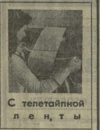
С телетайпной ленты

Помимо того, что в этом «документе» повторяются старые и уже давно известные оскомину мысли, он является грубой провокацией, подготовленной неизвестно где и неизвестно кем, но такой провокацией, в организации которых особенно специализируется ЦРУ. Она имеет своей целью стимулировать как внутри страны, так и за границей клеветническую антикоммунистическую кампанию, которую вот уже некоторое время ведут внутренние и внешние политические реакционные и консервативные силы. Этот «документ» является также низкой клеветой на коммунистические партии, в частности, на КПИ и КПСС.