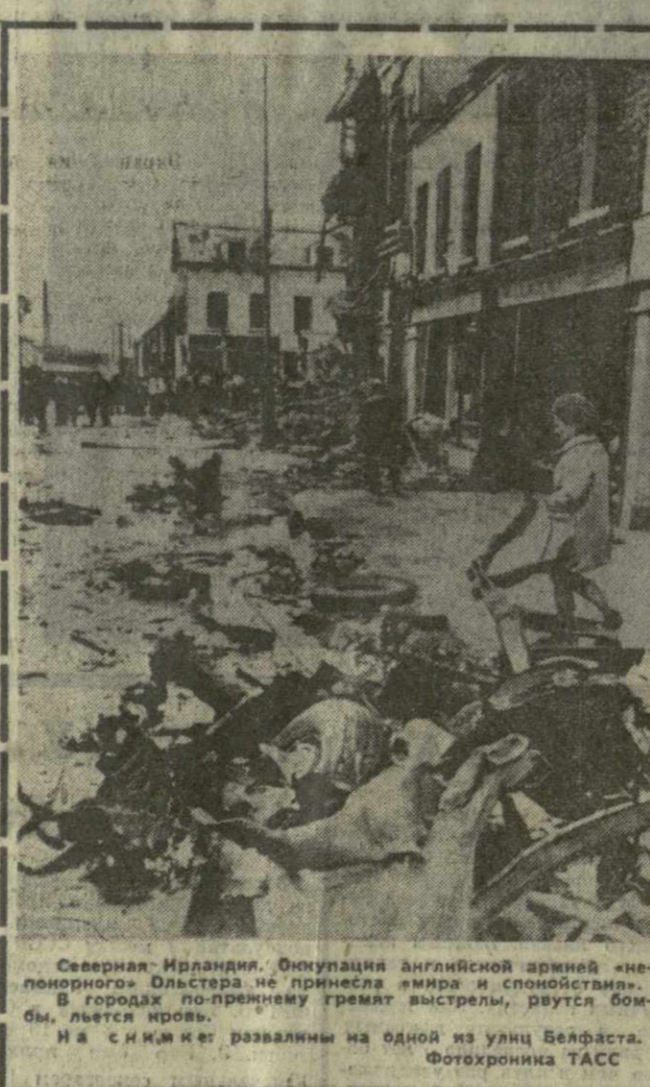
Северная Ирландия. Оккупация английской армией «непокорного» Белфаста не принесла мира и спокойствия. В городах по-прежнему гремит стрельба, рушатся бомбы, льется кровь.

КАРАКАС, 11 октября. (ТАСС). Состоявшаяся здесь 9-я конференция коммунистов федерального округа Венесуэлы единогласно приняла решение, в котором приветствуется правительство и советский народ по случаю предстоящего 50-летия образования СССР.