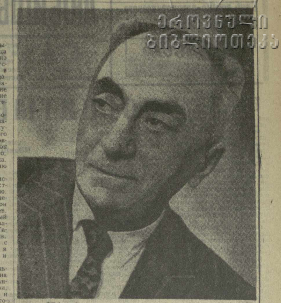
Юбилей нашего государства — воплощение идей ленинского гения. И как символ расцвета братских культур — в этом году особенно ярко многонациональную литературу народов нашей страны. Свидетельством тому все новые и новые произведения поэтов и прозаиков, драматургов и новеллистов.

Что же касается моего вклада, то в издательстве «Сабчота Сакартвело» выходит десятитомное собрание сочинений на грузинском языке, а издательство «Мерани» подготовило к выпуску восьмитомник моих произведений на русском языке.