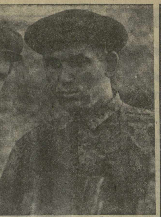
▲ НА БАТУМСКОМ МАШИНОСТРОИТЕЛЬНОМ ЗАВОДЕ ширится движение за достойную встречу XXV съезда КПСС. Между бригадами развернулось соревнование за право называться бригадой имени XXV съезда КПСС.