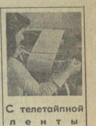
С телетайпной лентой