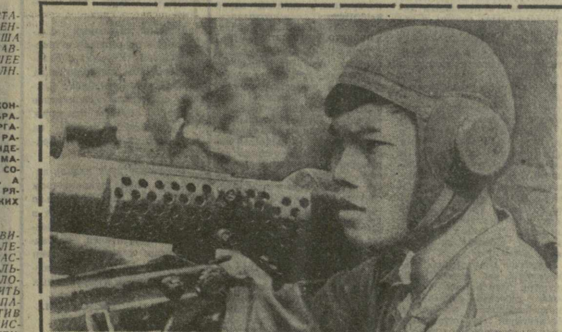
ЛАС. Бойцы НОАА ведут успешные действия против «специальных сил» генерала Банг Пао в провинции Сиенкуанг. Патриоты вывели из строя и взяли в плен большое количество солдат и офицеров противника.

В неравноправном положении продолжают оставаться американские женщины. Несмотря на то, что в 1970 году на производстве было занято более 40 процентов американских женщин, их заработная плата была в два с лишним раза меньше, чем у мужчин.