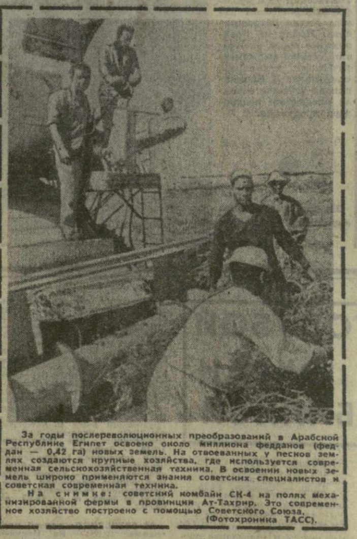
За годы послереволюционных преобразований в Арабской Республике Египет освоено около миллиона федданов (феддан — 0,42 га) новых земель. На освобожденных и песчаных землях создается крупное хозяйство, где используется современная сельскохозяйственная техника. В освоении новых земель широко применяются знания советских специалистов и советская современная техника. На снимке: советский комбайн СК-4 на полях механизированной фермы в провинции Ат-Тихрин. Это современное хозяйство построено с помощью Советского Союза. (Фотохроника ТАСС).

СОФИЯ, 20 октября. Копр. ТАСС А. Яковлев передает: Помыи успехами в труде, широким размахом социалистического соревнования встречают трудящиеся Болгарии приближающийся полувековой юбилей Советского Союза. Выполнив решение Политбюро ЦК КПСР о праздновании 50-летия СССР, окружные комитеты болгаро-советской дружбы разработали и уже начали осуществлять разностороннюю программу общественно-политических и культурных мероприятий, посвященных этой знаменательной дате. Замечательные достижения Страны Советов во всех областях жизни, ее значение и укрепление мирной системы социалистической системы стали темой лекций и вечеров, проходящих в Софийском округе. Будет проведена встреча бригад носивших имена советских героев, состоялись беседы на тему «Что дала болгаро-советская дружба моему предприятию», вечера специалистов, закончивших советские вузы.