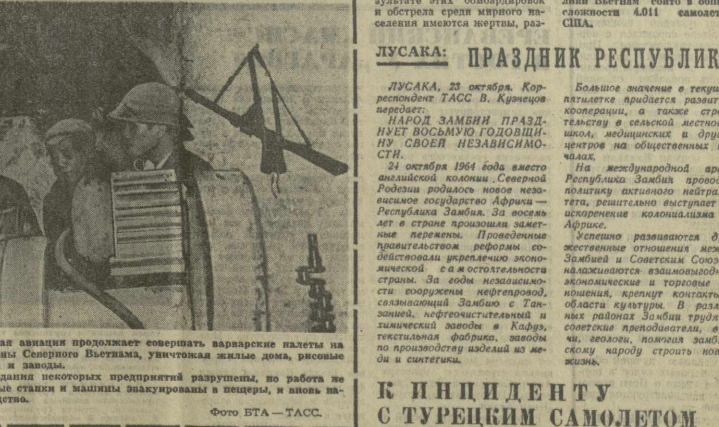
ДРВ. Американская авиация продолжает совершать варварские налеты на густонаселенные районы Северного Вьетнама, уничтожая жилые дома, рисовые поля, сады, фабрики и заводы.

АММАН, 22 октября. (ТАСС). Семь тысяч арабов — жителей оккупированного Иерусалима — сбрасывали в озеро гора Гейза брошенные без суда и следствия в тюрьмы.