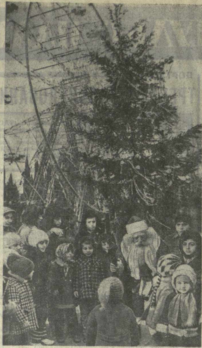
▲ НОВОГОДНЯЯ ЕЛКА в тбилисском Парке Победы.

Любители табака в 8—15 раз чаще страдают эмфиземой легких, в 3—5 раз — язвенной болезнью желудка, в 3—4 раза расширенном ар-