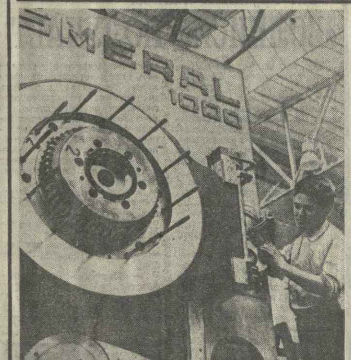
▲ ЧЕХОСЛОВАККИЕ ПРЕДПРИЯТИЯ РАПОРТУЮТ о досрочном выполнении заказов для Советского Союза. Бернские машиностроительные заводы имени Б. Шмеряла уже поставили в СССР на 7,5 миллиона крон продукции больше, чем предусматривалось соглашением. Предприятия изготовляют мощные прессы для Камского автомобильного завода. На снимке: сборка оборудования для КамАЗа.

домик Гарибальди, построенный им мельницу, другие постройки. На территории комплекса находится также могила Гарибальди, легендарного борца за объединение Италии.