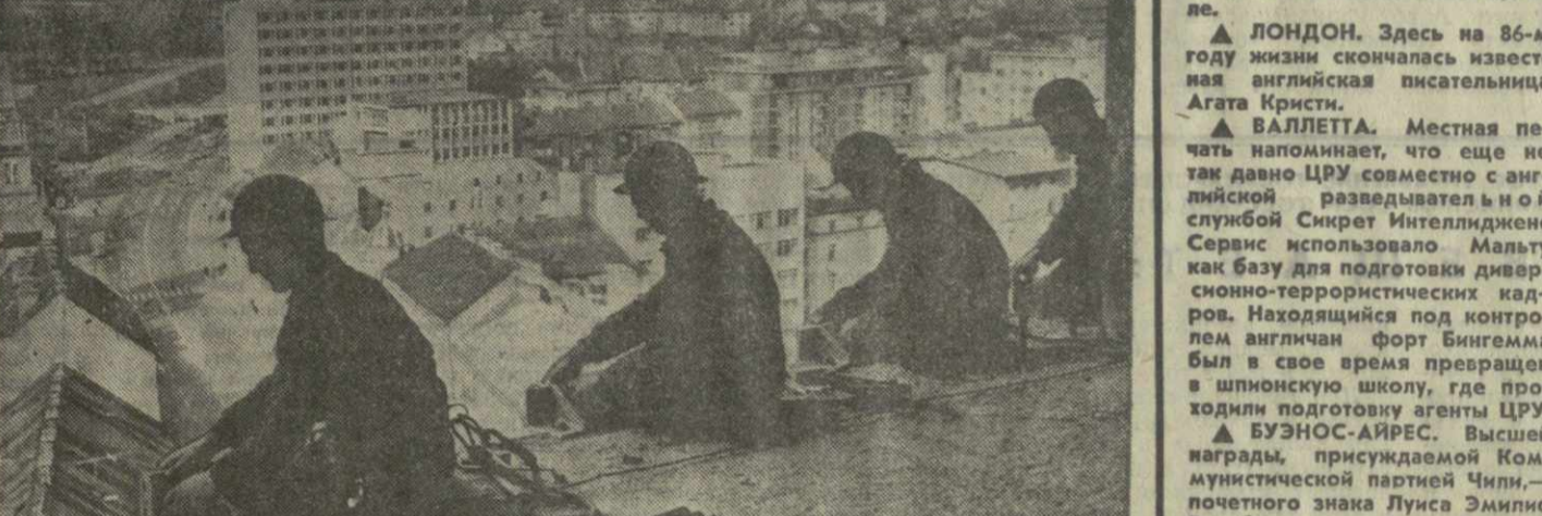
▲ В СОЦИАЛИСТИЧЕСКОЙ ФЕДЕРАТИВНОЙ РЕСПУБЛИКЕ ЮГОСЛАВИИ ширится жилищное строительство, в городах растут новые благоустроенные кварталы. На снимке: строительство жилых домов в столице Словении — Любляне, городе-побратиме Тбилиси.

В самом Иерусалиме проведены аресты среди палестинцев. Как сообщают палестинское информационное агентство, накануне начала заседаний Совета Безопасности арестовано 26 человек.