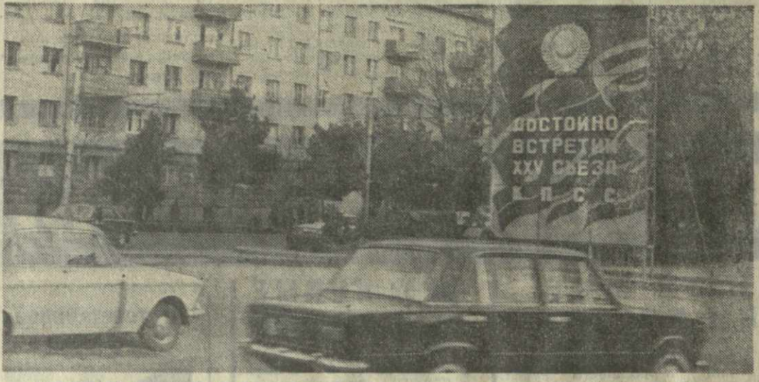
▲ РУСТАВИ СЕГОДНЯ. На снимке: один из уголков города.