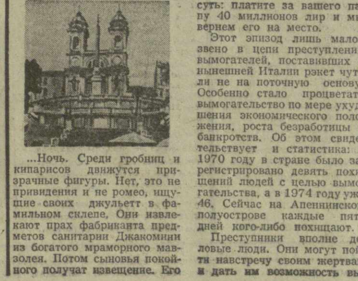
...Ночь. Среди гробниц и кипарисов движется призрачная фигура. Нет, это не привидение и не роман, иллюзия своих дум роет в фамильном склепе. Оди навлек на прах фабриканта предков санитария Джоконды из богатого марморного мавзолея. Потом сыновья покойного получают извещение. Его