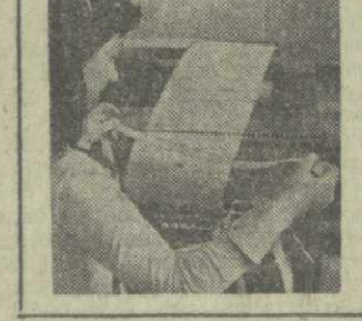
стлывой случайности террористический акт не привел к жертвам.

ЛУАНДА. Здесь официально объявлено, что исполняющая 4 февраля 15-я годовщина со дня начала борьбы ангольского народа за свою свободу и независимость будет торжественно отмечена по всей стране.