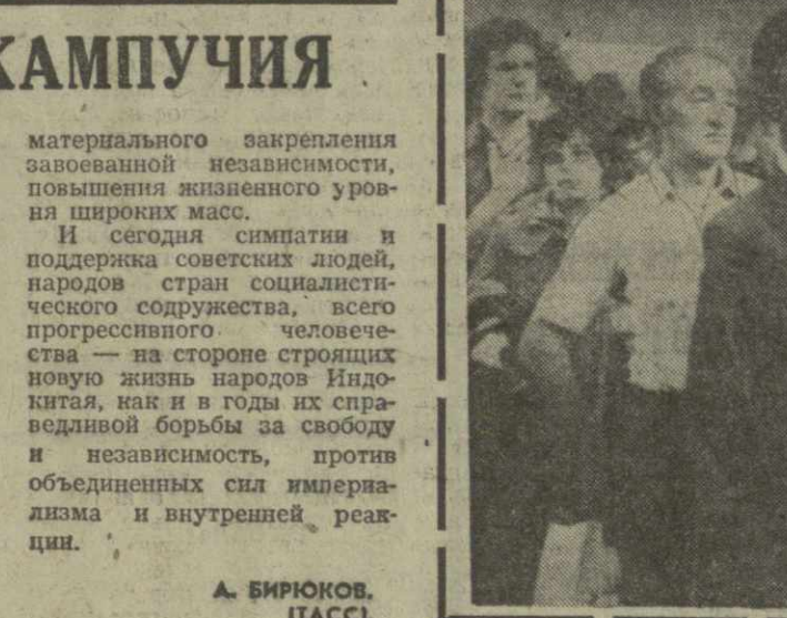
А. БИРКОВ, (ТАСС).

Среди них, как сообщает Национальный союз борьбы против расовых и политических репрессий, — Денис Бэнкс и его товарищи, священник Бенджамин Дэвис