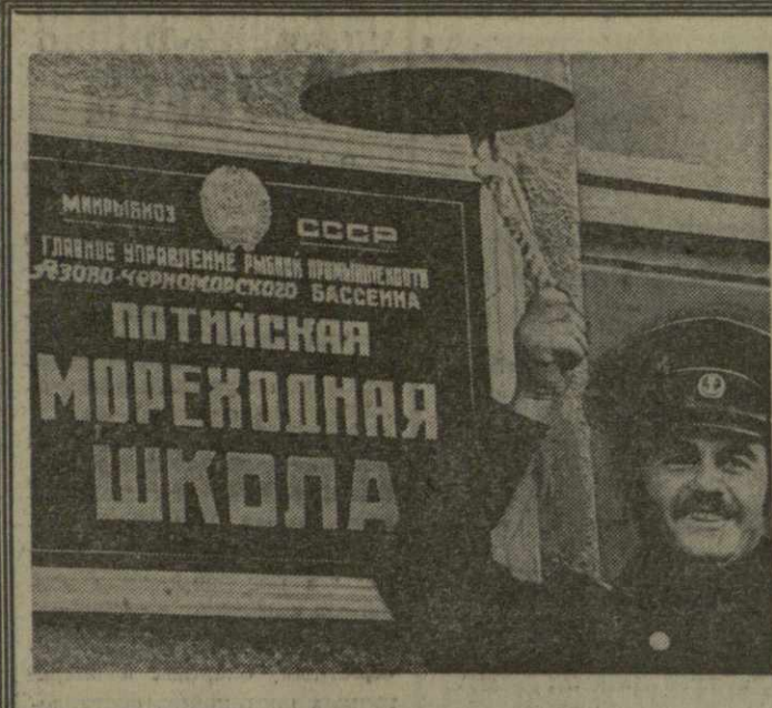
ПОТИЙСКАЯ МОРЕХОДНАЯ ШКОЛА