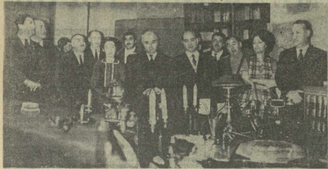
МОСКВА. 11 ноября члены делегации Грузинской ССР посетили Музей-квартиру В. И. Ленина в Кремле. На снимке: в рабочем кабинете В. И. Ленина. Фото Г. Киквадзе. (Принято по фототелеграфу Грузинформ).