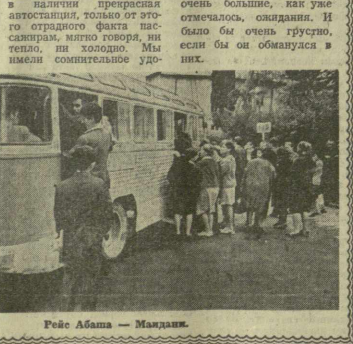
Рейс Абаши — Мандани.