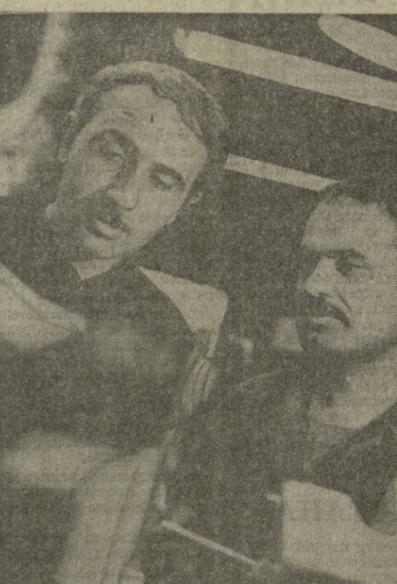
▲ В ТЕХНОЛОГИЧЕСКОЙ ЛАБОРАТОРИИ Тбилисского завода шифровальных станков прошел испытание станок скоростного шифрования 3А110В, который по точности и скорости превосходит ранее выпускавшийся более чем в два раза.