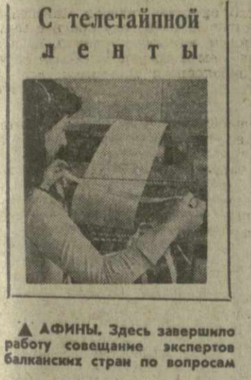
С телетайпной ленты

Позвали бы да хлопнули в ладоши, — И в не устоял бы, как исповешный, Пустился в пляску, как хуцурский витязь... Но стали резне очертанья скал, И солнце, чежась, опустилось в Свиньях, Како солнце! Свет багряно-ад