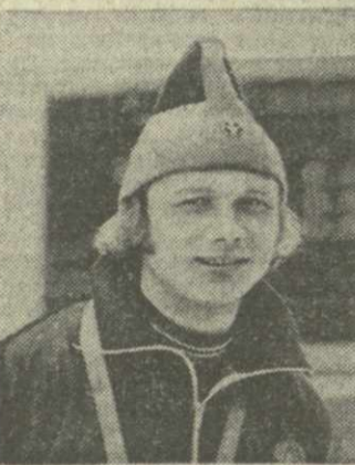
На снимках: олимпийские чемпионы в спортивных танцах В. Пахомова и А. Горшков, победитель в скоростном беге на 500 м Е. Куликов.