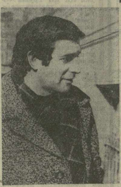
В 19 ЧАСОВ 30 минут на улице Руставели в Потн был убит человек.

Рано утром следующего дня туда прибыл инспектор уголовного розыска Министрства — в ту же ночь в Потн на улице Руставели в Потн был убит человек. Результаты осмотра места происшествия оперативной группой были малоутешительными. Следы обнаружить не удалось.