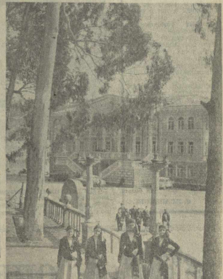
С каждым годом все благоустроенней становится село Грузии. На снимке: административное здание колхоза села Шрома Махарадзевского района.

Н. ХАСАЯ, руководитель комсомольско-молодежной бригады Ачигварского чайного совхоза, член ЦК ЛКСМ Грузии.