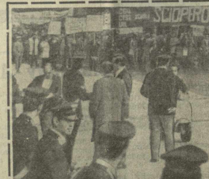
Рим. Тысячи итальянских учителей провели 48-часовую забастовку. Они требуют увеличения заработной платы, которой в условиях растущей стоимости жизни не хватает для нормального существования.

Сегодня на выставке побывала премьер-министр Республики Шри Ланка Сиримава Бандаранайке. Она с большим интересом ознакомилась с представителями и здесь стоянками, сельскохозяйственными машинами, изделиями легкой промышленности, моделью космического корабля «Восток» и другими экспонатами. «Все это вызвало во меня незабываемое впечатление, — заявила премьер-министр после осмотра экспозиции. — Это прекрасное свидетельство огромных достижений Советского государства».