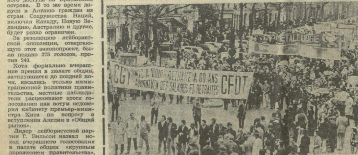
Ширится борьба французских трудящихся в защиту своих прав и в поддержку требований о повышении минимальной заработной платы, снижении пенсионного возраста и увеличения пенсионных пособий. На снимке: массовая демонстрация в Париже.

ГРУЗИЯ — 1922: ОТЧЕТ ИЛЬИЧУ ГРУЗИЯ — 1972: РАПОРТ РОДИНЕ... По страницам газет.