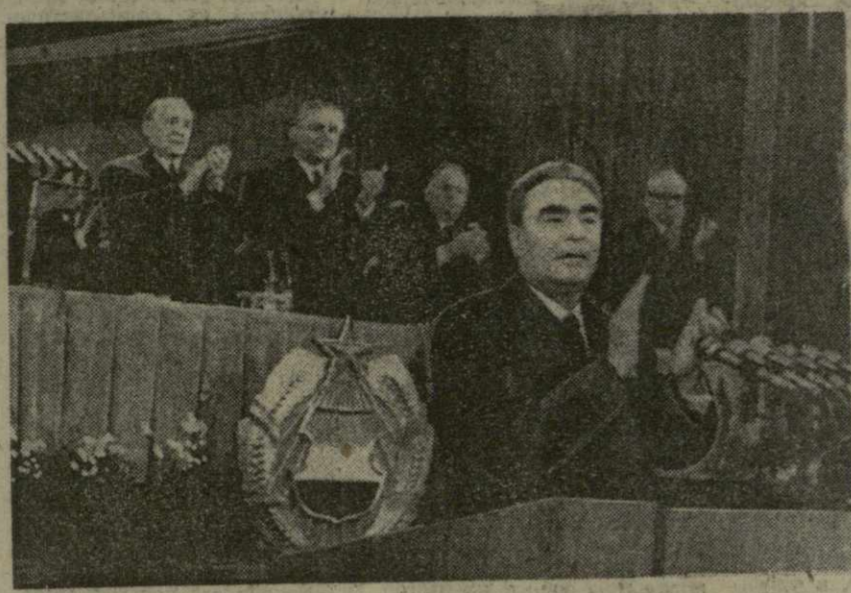
Будапешт, 30 ноября. Митинг венгеро-советской дружбы на Чепельском металлургическом и машиностроительном комбинате. На трибуне — Генеральный секретарь ЦК КПСС Л. И. Брежнев. Справа — в зале во время митинга.