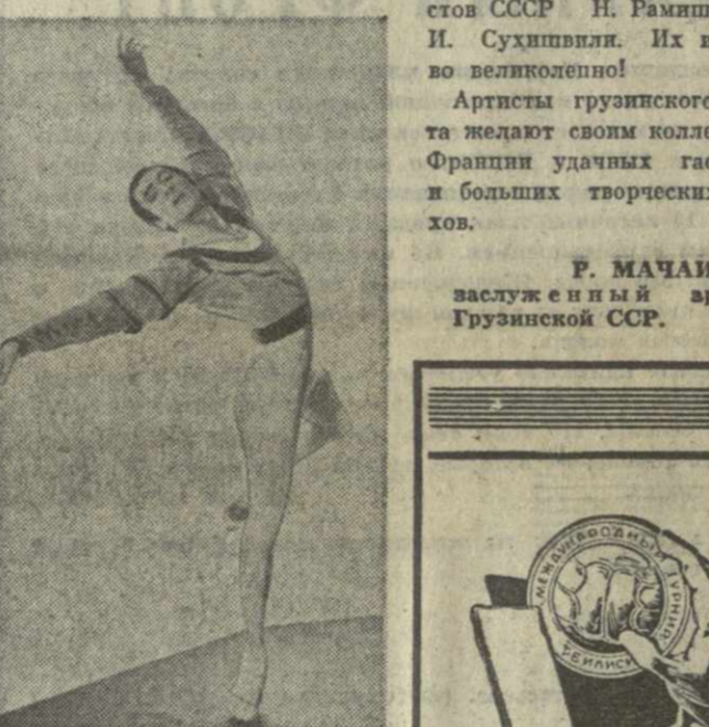
Ф. МАЧАИДZE, заслуженный артист Грузинской ССР.