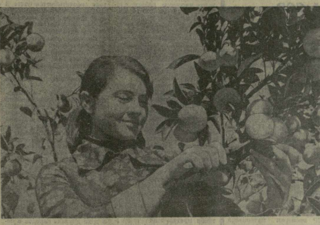
Урожай радует. Колхозники в селе Натанеби 3. Надирде собирают до 300 килограммов цитрусов в день.