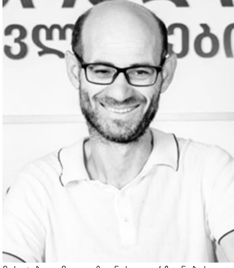
მესიჯები გამოგვიგზავნეს და არჩევნების ლეგიტიმურობა არ ცნეს. საგარეო პოლიტიკის თვალსაზრისით კიდევ ერთხელ დადასტურდა, რომ „ქართული ოცნება“ რეალურად რუსული ოცნებაა და ქვეყანას რუსეთში მიატოვებს... ცდილობს...