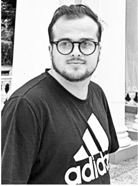
ოვს, რომ მოსახლეობამ ხმა მისცა ცვლილებებს.

„ობიექტური“, „სამართლიანი“, „არადემოკრატიული“, „გაყალბებული“ არჩევნები - სწორედ ასე რადიკალურად განსხვავებულად აფასებენ მმართველი გუნდისა და ოპოზიციის წარმომადგენლები 2024 წლის საპარლამენტო არჩევნებს, რომელმაც ხელისუფლება და ოპოზიცია ერთმანეთს კიდევ უფრო დააპირისპირა. უდავოა, რომ საქართველოში პოლიტიკური ტემპერატურა მაღალია, პროცესები - მრავალფეროვანი და დამაფიქრებელი. მმართველი პარტია - დამაჯერებელ გამარჯვებულზე, ოპოზიცია კი გაყალბებულ არჩევნებზე საუბრობს და პარლამენტში შესვლაზე უარს აცხადებს. ხელისუფლების წარმომადგენლების თქმით, არჩევნებმა ცხადყო, რომ მმართველი პარტია კვლავ პოპულარულია, ხოლო ოპოზიცია - დაქსაქსული. თავის მხრივ, ოპოზიცია ამტკიცებს, რომ მათ აქვთ უტყუარი მასალები არჩევნების გაყალბების შესახებ. ანალიტიკოსთა თქმით, თუ დასავლეთი არ აღიარებს არჩევნების ლეგიტიმურობას, ეს საქართველოსთვის დამღუბლებელი იქნება, რადგან ქვეყანა იზოლაციაში აღმოჩნდება, რაც სწორედ რუსეთის სანუკვარი მიზანია. ასეა თუ ისე, ერთი რამ ცხადია: საქართველოს ცხოვრებაში ახალი ეტაპი დაიწყო.