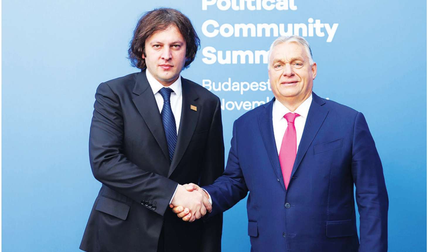
თემა ევროპის უსაფრთხოების გამოწვევებია. მოსვლა პანელურ დისკუსიაზე და სამიტის ფარგლებში გათვალისწინებული თემატური დისკუსიები. დაგეგმილია პრემიერ-მინისტრი ირაკლი კობახიძის სიტყვით გამოსვლა პანელურ დისკუსიაზე და სამიტის დასკვნით პლენარულ სესიაზე.

„განსაკუთრებით საინტერესოა, რომ ეს ღონისძიება ბუდაპეშტში, უნგრეთის მასპინძლობით ამერიკის საპრეზიდენტო არჩევნების შემდეგ მალევე ტარდება. მექნება გამოსვლა თემატურ პანელზე, ასევე, დასკვნით პლენარულ სესიაზე, სადაც გაუღებდება გზავნილები იმაზე, რაც უკავშირდება ჩვენს ქვეყანას და ჩვენი ქვეყნის გარშემო მიმდინარე მოვლენებს. ასევე გვექნება შესაძლებლობა, ევროპულ ლიდერთან გავისაუბროთ ყველა იმ თემაზე, რაც არის საინტერესო საქართველო-ევროკავშირის ურთიერთობების კუთხით. მათ შორის, საუბარი გვექნება საქართველოს საგარეო პოლიტიკურ პრიორიტეტზე, რაც არის ევროკავშირში ინტეგრაცია. ვისაუბრებთ საქართველოში მიმდინარე პროცესებსა და საქართველო-ევროკავშირის ურთიერთობებზე“.