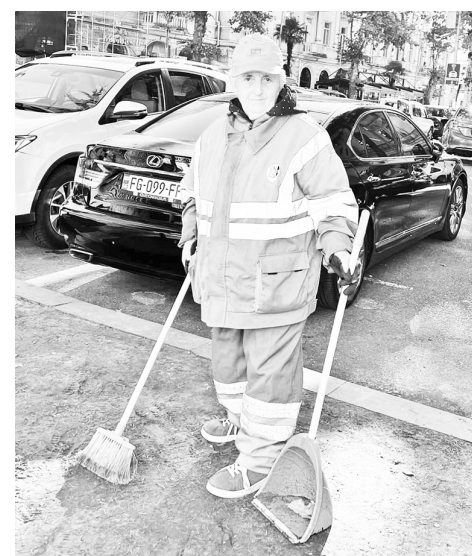
იხ. მე-8 გვ.

დასაქმებული ვარ და საკუთარი საარსებო წყარო მაქვს. მთავრობა ხელფასების მომატებას დაგვიპირდა. მათი თქმით, ჯამში 3 ათას ლარამდე უნდა გაიზარდოს ჩვენი ხელფასი, რის გამოც მადლობლები ვართ.