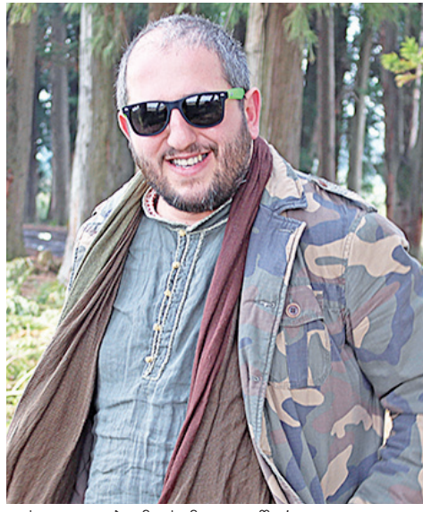
ფესტივალები მისამდეა გაწერილი.

- და იცით - რატომ? მინდობდა, ვინმე პროფესიონალს, კვალიფიციურ ჟიურის ენახა და შეეფასებინა ფილმი, ეთქვა თავისი მოსაზრება - რა გავაკეთე სწორად, რა - არა... ფილმი შეიძლება გადაიღო, მაგრამ შემდგომი ეტაპიც ძალიან მნიშვნელოვანია - როგორ შესთავაზებ, გაყიდი თუ ვერა... აქ ჩემი მენეჯერული გამოცდილება გამოვიყენე - ხშირად ოთხი საათიც კი ვიჯექი ინტერნეტში და ვეძებდი ფესტივალებს. მოგესვენებთ, თითოეულს თავისი დებულება, პირობები აქვს, თუ როგორ უნდა იყოს გადაღებული... რეგისტრაციას ფული სჭირდება, მერე ფესტივალის ხელმძღვანელობა ან მიიღებს ან - არა და ეს ფული ხომ იკარგება?! მაგალითად, ბრაზილიაში ერთმა წარმომადგენელმა მომწერა, 2600 ფილმი შემოვიდა, აქედან 1331 იყო საერთაშორისო, რომელთაგან მხოლოდ 15 შეირჩაო და... ერთ-ერთი ჩვენი იყო. ნომინაციაში მამაკაცის როლის საუკეთესო შესრულებისთვის პრიზი ჩვენმა ფილმმა მიიღო.