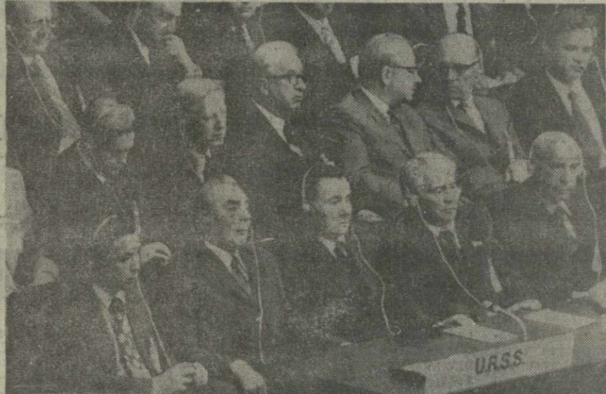
Открытие завершающего этапа Совещания по безопасности и сотрудничеству в Европе. На снимках: слева — советская делегация в зале заседаний, справа — во время открытия Совещания.