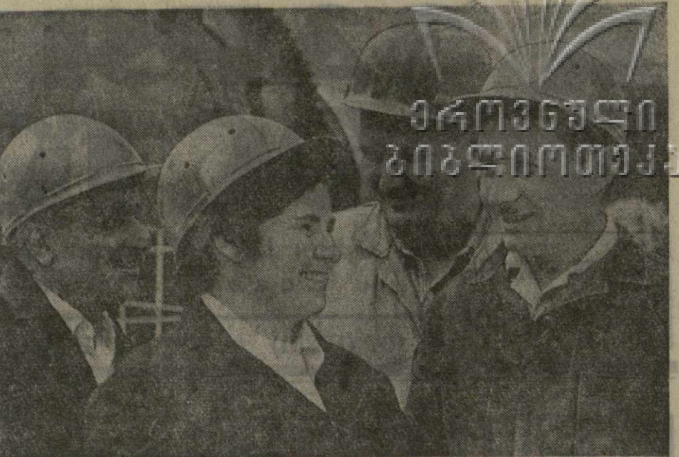
▲ ВЫСОКИМИ ПРОИЗВОДСТВЕННЫМИ ПОКАЗАТЕЛЯМИ встретил XXV съезд КПСС Под этим девизом трудится коллектив Каспского цементного завода и успешно претворяет его в жизнь.

Э. ШЕВАРДНАДЗЕ, Первый секретарь ЦК Компартии Грузии. («Правда», 10 августа).