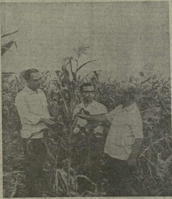
ТРУЖЕНИКИ КОЛХОЗА ИМЕНИ КИРОВА села Качрети Гурджаанского района обязались получить не менее 30-35 центнеров кукурузного зерна с каждого гектара вместо плановых 22.

30 и 31 августа — республиканский смотр посевов кукурузы, поживных и промежуточных культур