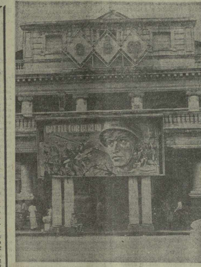
Столица Бирмы Рангун, расположенная на площади 320 кв. км в дельте реки Иравади, — крупнейший промышленный центр страны. В настоящее время в ней насчитывается около двух миллионов человек населения. Рангунцы с гордостью называют свой город морскими воротами Бирмы.

Венки к памятникам воинам Советской Армии были возложены также в Чхончжине, Вонсане и других городах страны.