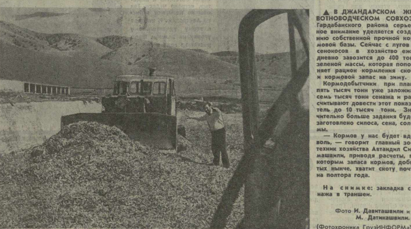
▲ В ДЖАНДАРСКОМ ЖИВОТНОВОДЧЕСКОМ СОВХОЗЕ ГАРДАБАНСКОГО РАЙОНА серьезное внимание уделяется созданию собственной прочной кормовой базы. Сейчас с лугов и сенокосов в хозяйство ежедневно завозится до 400 тонн зеленой массы, которая пополняет рацион кормления скота и кормовой запас на зиму.

В то же время бригада Картвелишвили в своих обя-