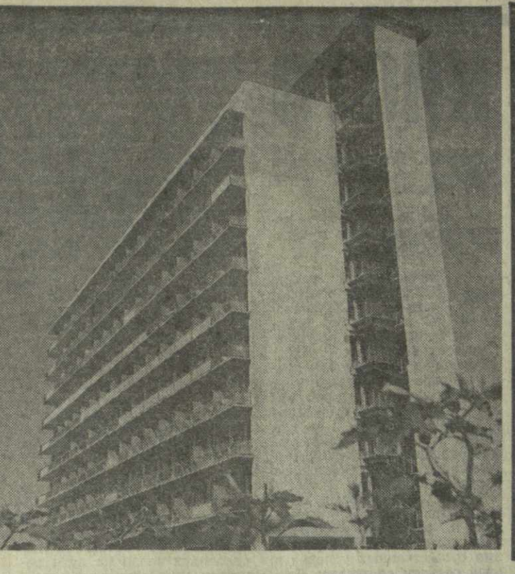
На снимке: пансионат «Гудаута».

новили попутную машину и, уже сидя в ней, заметили, как из дверей «Арагии» вышла группа посетителей.