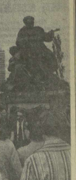
▲ СОФИЯ. На снимке: туристы из СССР у братской могилы погибших советских воинов.