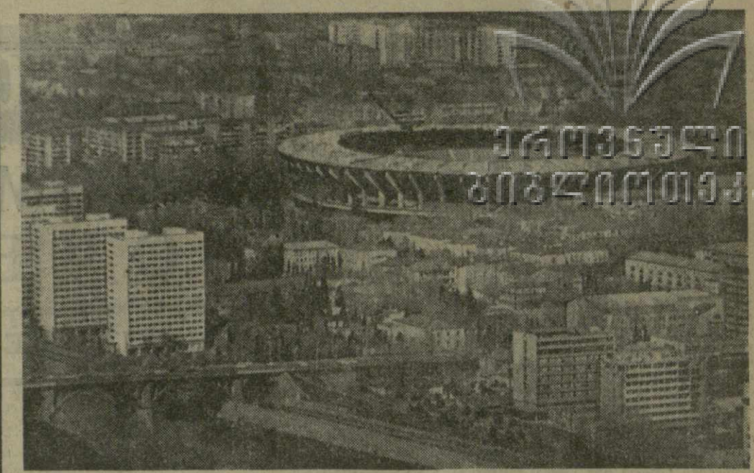
▲ ТБИЛИСИ СЕГОДНЯ. Вид с верхнего плато фуникулера.

сты отличаются прекрасными вокальными и сценическими данными, хорошо звучит хор, оркестр. Постановочное искусство отмечено высочайшей культурой. Незагадочное впечатление произвела на меня симфоническая сказка Сергея Прокофьева «Петя и Волк». Каждый номер партитуры можно смело назвать шедевром жемчужной, переходящей в единую, замечательная и а образности, мелодическая выразительность, лаконичность и глубина — все это присуще музыке Прокофьева. Каждый персонаж индивидуализирован, характеризуется соответствующим музыкальным звучанием. Зал был перепол-