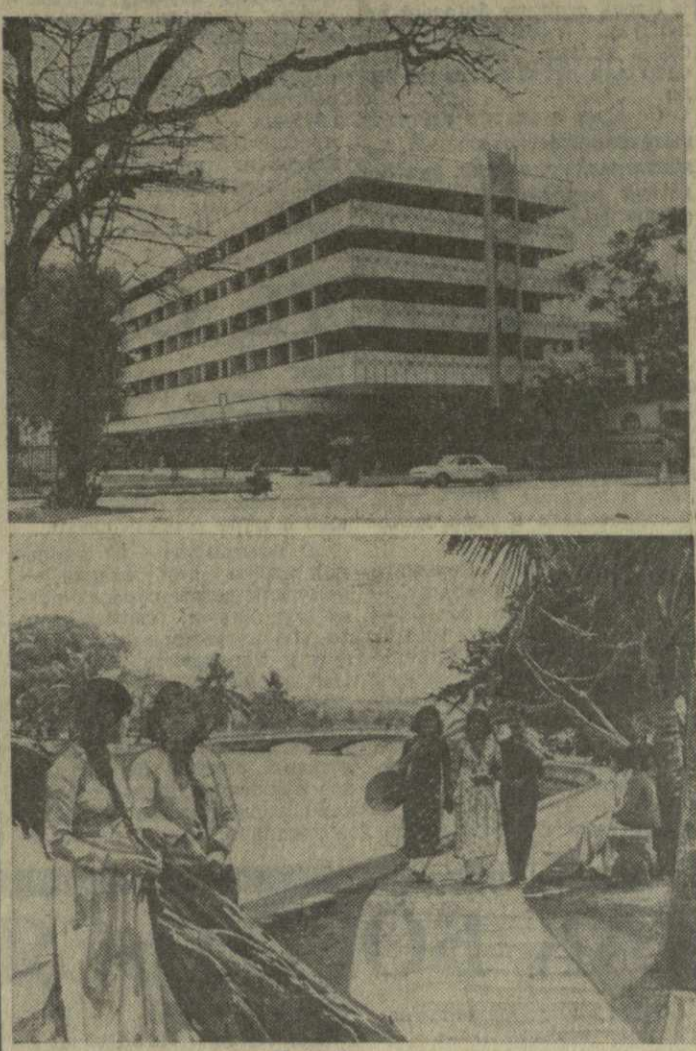
▲ ХАНОЙ — крупнейший промышленный центр Вьетнама. Здесь больше 180 заводов, фабрик, электростанций, мастерских, около 350 производственных кооперативов. Рабочий класс города на Красной реке насчитывает более 120 тысяч человек.

На снимках: новые дома выросли на месте разрушенных строений за годы восстановительного периода; в парке «Единства».