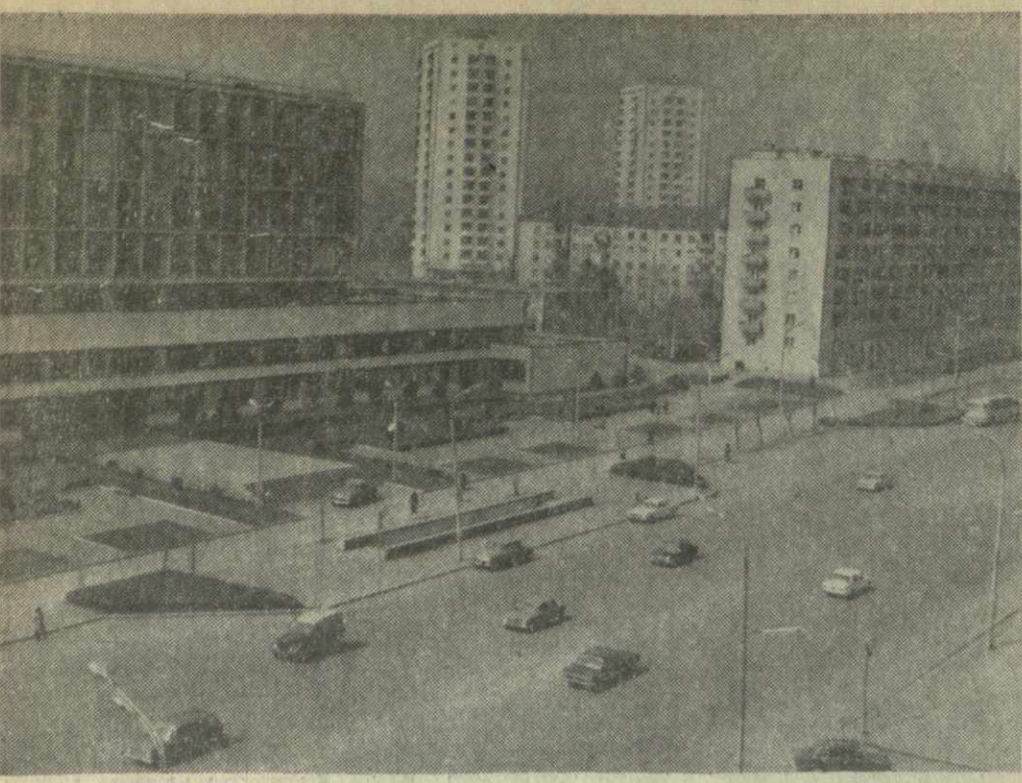
▲ ТБИЛИСИ СЕГОДНЯ. На снимке: один из уголков Димитровского массива.