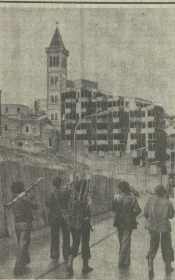
▲ БЕИРУТ. Внутривластный кризис в Ливане продолжается. В столице страны сохраняется напряженная обстановка. На снимке кр: вооруженные люди на улицах Бейрута. (ТАСС, 31 марта).

В Народном собрании Египта: «Я стремился к подписанию договора с Советским Союзом во имя нашего будущего и будущего наших потомков». Договор был призван закрепить высокий уровень отношений между Советским Союзом и Египтом — государством, освободившимся от империалистической зависимости и поставившим своей целью борьбу за укрепление своего суверенитета и экономической самостоятельности, за социальный прогресс. На протяжении более чем двух десятилетий дружественного советско-египетского сотрудничества в интересах антиимпериализма и чести и свободы народов, говорится в заявлении, Советский Союз оказал Египту большую помощь в развитии экономики, в укреплении обороноспособности Египта. В заявлении отмечается, что за последние годы начался отход египетского руля от политики сотрудничества с Советским Союзом, от принципов советско-египетского договора. Это вызвало проявление в волеисполнении египетского правительства в отношении АРЕ, египетского народа. Идея заключить советско-египетский договор не раз высказывалась президентом Насером в беседах с советскими руководителями. Не кто иной, как президент Садат также заявил в 1971 г.