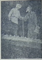
მუშა-ახალგაზრდა — „306-308“

ურთობის განვითარება შევჩერებულ ტექნიკით მიდის წინ, სადაც შენდება ახალი გვიანტები, სადაც ლოზუნგი — დამუშავოთ და ააყურეთოთ მოწინავე კაბიტალისტურ გვიანტებს ტექნიკური განვითარების მხრივ — რეალურად სრულდება. ამდენ დროს მთელი კაბიტალისტური მსოფლიო განიღდის რომა გეომათურ კრიზისს, რომლისაგან გამოსავალს ის ეძებს ახალ იმპერიალისტურ ომებში და პირველყოფილსა, სმბოთი აქვეყნის წინააღმდეგ ინტერვენციის მოწოდებაში. ეს გარემოება ჩინი გვიგადუნებს განსაკუთრებული უპრობლემა მივაქცობთ ჩვენი ქვეყნის სამხედრო ძლიერების განმტკიცებას და მუდამ მზად ვყოფიან მტრისათვის საკადროსო პასუხის ვასაყენად.