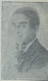
მსახიობი აბას შუკბანოვი

მხურვალე სალამი სახელმწიფო თურქული თეატრის სახელოვან კოლექტივს