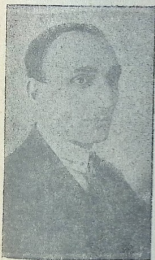
რეჟ. ს. ა. არტ. ინარგინი ინვაპანლიანი