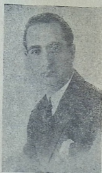
მსახიობი ასპრ ხალილოვი