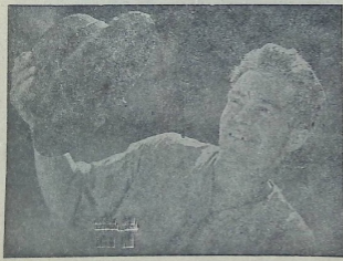
მნივანი კინო-ფილმი „კომუნისტური“

მერეც ბოქოლდის დასარბერლობისათვის, როგორც კლსი ჩოკორი ამითი ურეს მოსპობის, ჩინე ურეს ურეს ვადამუშავებრე კომუნისტური აღმინებრე, სოციალისტური საზოგადოების შეგმრბელი წევრები, იმისათვის, რომ ამ მიზნის მიეღწეობი და შედეგად