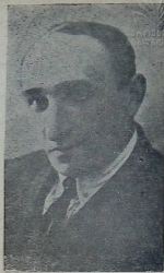
რესპ. სახ. არტ. ალ. იმედაშვილი.

ზონის შინაგანი ტემპერამენტი. ემოციონალური დრამატული სიტყვა უბრალო არა გარკვეული და მატერიალი, არამედ შინაგანი ცუტხლით ართოლებული და მოლის სიტყვა ქართული სპექტაკლით გამართული: პლასტიური, ყოველიც მარცხალოა ასამაღლებელ მხედრულ მოკლებული, რომელსაც თავლის საწოელის სამკვირვე და მოქნილობა ზვეს და ადელა ამას მიუმატეთ ბარიტონალური ტემპების ხმა, რასაც აღმდეგაშვილი ყოველ გამოსვლის წინ სინჯავს ისე, როგორც ტრიბუნი ვაი ვრატეი ვარჯიშობდა თავის მონათთან ფლეიტაზე, რომ ყოველი მისი სიტყვა მუსიკალური ყოფილიყო. ქართული წარმოქმნის, გრამატიკის და ანბანის შეშნა უშუალო და მრავალფეროვანი ტემპერამენტის გეშლა ქართული სცენაზე ალ. იმედაშვილის გაუტყობი და იგი ამ შემთხვევაში უკვე მაგალითი კი არა, ნიმუშიც არის და იგი ასეთი სიტყვა და ტემპერამენტით მუდის დღესაც, როგორც მსახიობი, როგორც მოქალაქე, რომელსაც კიდევ ბევრ სასცენო ანოცანას გადასჭირის მომავალში და ჩვენ ეჩვიობით ორმე ალ. იმედაშვილის ოცდა ათი წლის სასცენო მოდერნიზაცია ეს უფრო იმისათვის, რომ იგი ჩვენს რეპერტუარს, როგორც ნაკადი მებრძოლი საქართველოს სამკითი თეატრის ასაშინებლად და განსამტკიცებლად.