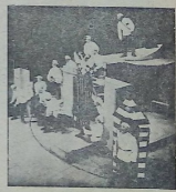
„სამი ეპოქა“ დღემა შ. მანნაძის.

წლის თეატრი გაძლიერდა თავის შემაგველობით და მასთან დაკავში- რებით გაძლიერდა მისი საწარმოო გეგმა.