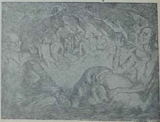
ჩინეთი — განწირულნი. მხატვ. ვუდიაშვილი.

ლოკაფმა და საერთოდ ჩვენი პროლეტარული მუიუქობამ ამ მხრივ ყოველ უფრო მეტად უნდა გაამზავილოს მუიუქობა. როგორ უნდა ემხატვროს საბჭოთა თეატრი წითელი არმიის? ეს მტკიცებული საკითხია, რომელზედაც ჩვენი თეატრები ერთხელაც არ ატყევიანთათი. საბჭოთა ვაჭმირის თავდაცვის საკითხი — და ამ საკითხთან დაკავშირებული წითელი არმიის ზოფა-ცხოვრება, საბრძოლო უნარობა და სხვა სრულიად არ აღვლევს ჩვენს თეატრებს. წითელი არმიის მე-14 წლის თავზე ჩვენს