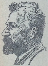
ს. ა. ა. (ბ) ა. ა. სამხატვრო კომპარტიის პირველი მდიანი ახ. მამია ორასენა-შვილი

გაუმარჯოს პარტიისა და მუშათა კლასის ბედდას ამხ. სტალინს!