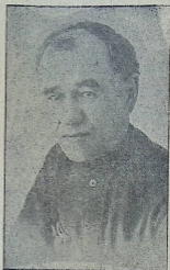
რეჟ. დამაბურ. მსახიობი მ. ა. აბასოვი