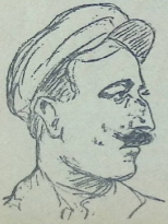
„საქართველო“-ს დამაგმობელი მუშა

წითელ-წყაროს ძველი სტოლის ყაზარმული ნაგებობანი ამჟამად მეტყველებენ. რომ იქ უწინ გარო იყო და ბანაკებელი. ესაა ამ ყაზარმებში ინდუსტრიალური ცხოვრება. ერთ ყაზარმაში მექანიკური სახელოსნოა, მე-