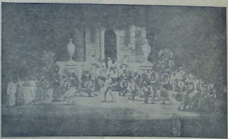
საბ. ოკპისა, „დონ-კიხოტი“

დაცემის გამოიკვება. რომ მუშაინსტრუქტის დღემდე არ არის დახვეწული, ჩვენთვის სოციალურად უცხოა პედაგოგებისა და სტუდენტებისაგან, ის, რაც ყოფილ დარეკების—ხიფტიკის დროს ხდებოდა სახელმწიფო ფუნდების უფროათო ხარჯვის სახით, ეხლად გრძელდება. რაც ამავე სახ. ოპერას დღემდე არ განიხილა თავის საწარმო ვეგება, არ არის გაწვლილი სოციალური და დამკვეთლომა თეატრის მუშა-მოსამსახურეთა შორის. შრომის ეს საბლი პრიციპი და ფორმა, ოპერის მოსამსახურე-