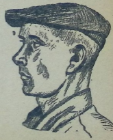
„საქართველო“-ს დამაგმობელი მუშა