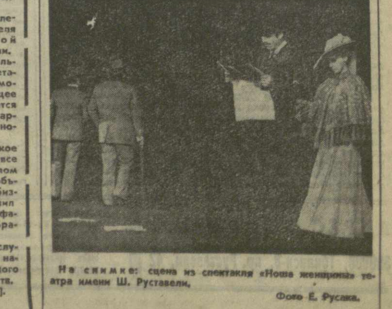
На сцене: сцена из спектакля «Ночь женщины» театра имени Ш. Руставели.

А. АНКАРА . Здесь объявлено об аресте представителя американской авиации и о компании «Локхид» в Турции. КОПЕНГАГЕН . Все большую популярность приобретает в Дании советский автомобиль «Жигули». В настоящее время в стране насчитывается 15 тысяч автомобилей с маркой Волжского автомобильного завода. БРАЗИЛИЯ . Медицинское обслуживание в Бразилии все чаще становится средством коммерции, а пациенты — объектом наживы для врачей-бизнесменов. Об этом заявил профессор медицинского факультета университета г. Бразилиа Р. Сараяна. Профессор указал на случаи ненужных операций и называемых большим огромным количеством дорогих лекарств. (ТАСС, 13 января).