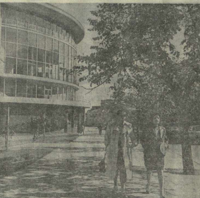
ТБИЛИСИ СЕГОДНЯ. Улица Меликшивили.