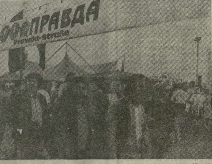
В ДЮССЕЛЬДОРФЕ состоялся праздник газеты западногерманских коммунистов «Уизерецайт». В нем приняли участие десятки тысяч жителей ряда промышленных центров Рурского района. Праздник коммунистической печати ФРГ прошёл под знаком дальнейшего сплочения трудящихся в борьбе против наступления монополий, против роста дороговизны и безработицы, за укрепление мира и безопасности в Европе, под знаком упрочения связей с братскими партиями других стран.