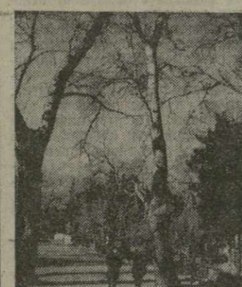
Благодаря усилиям партии и правительства, в Грузии осуществлены кардинальные меры по улучшению охраны природы и рациональному использованию природных ресурсов, однако проблема пока еще далека от разрешения. Все еще не своевременно и неудовлетворительно выполняются решения ЦК КП Грузии и Совета Министров Грузинской ССР по многим вопросам, связанным с мерами по защите природы. А между тем нарушение правил лесопользования, вредители и болезни нанесли серьезный урон лесным богатствам Грузии; значительная часть промышленных и хозяйственных стоков вод вовсе не подвергается очистке, а более чем половина очистных систем работает неэффективно. Загрязняются реки, водоемы, побережья Черного моря. По сей день более трети всей питьевой воды в республике расходуется на технические нужды и полив зеленых насаждений, а около сорока процентов теряется в