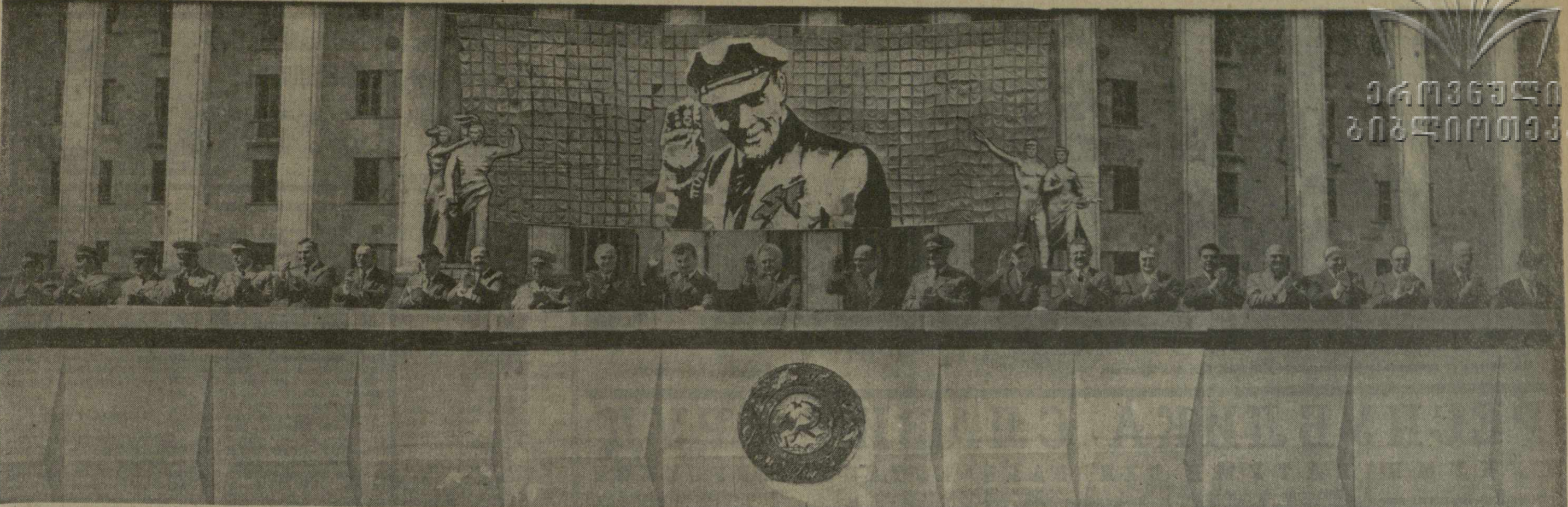
ТБИЛИСИ. 1 Мая 1976 года. На центральной трибуне.