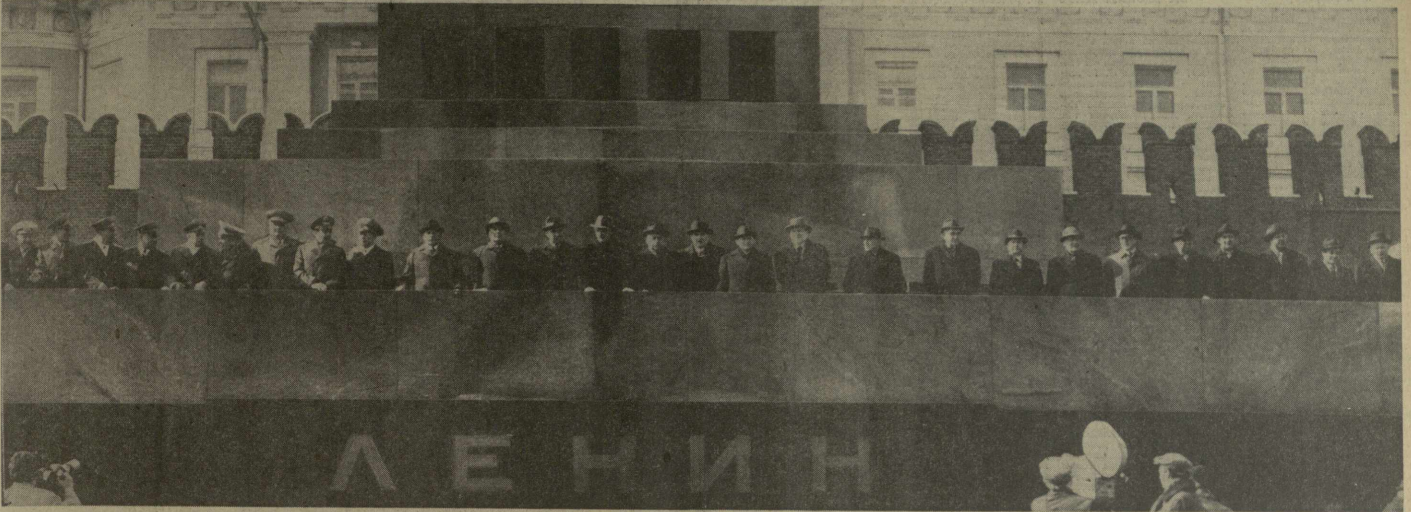
МОСКВА. Празднование 1 Мая 1976 года. Демонстрация представителей трудящихся на Красной площади. На снимке: на трибуне Мавзолея В. И. Ленина.

№ 102 (15469) • ВОСКРЕСЕНЬЕ, 2 М А Я 1976 ГОДА • Цена 2 коп.