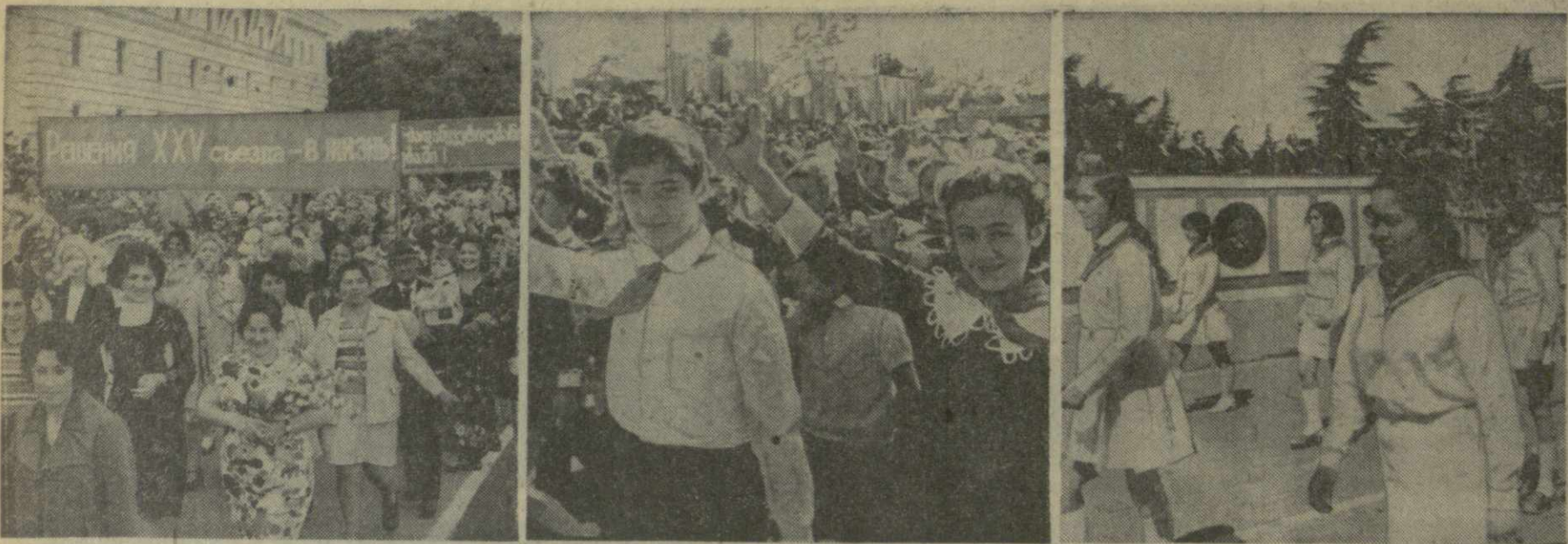
На снимке: праздничные демонстрации в Сухуми, Батуми и Цхинвали.