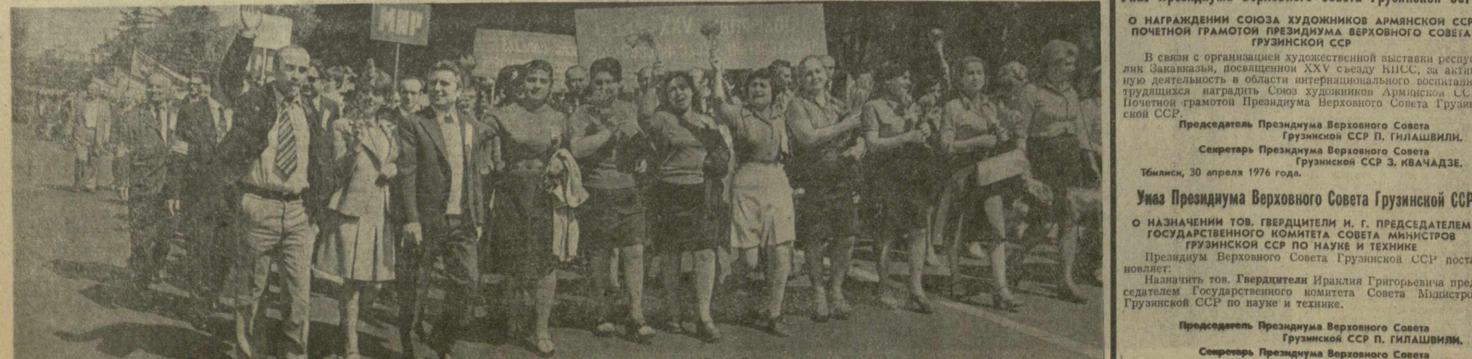
ТБИЛИСИ. 1 Мая 1976 года. На снимке: представители трудящихся города на демонстрации.

Во главе колонны, вступающей на площадь Ленина, — лучшие труженики республики. Среди них делегат партийного съезда Герой Социалистического Труда Тлячха шелкового комбината