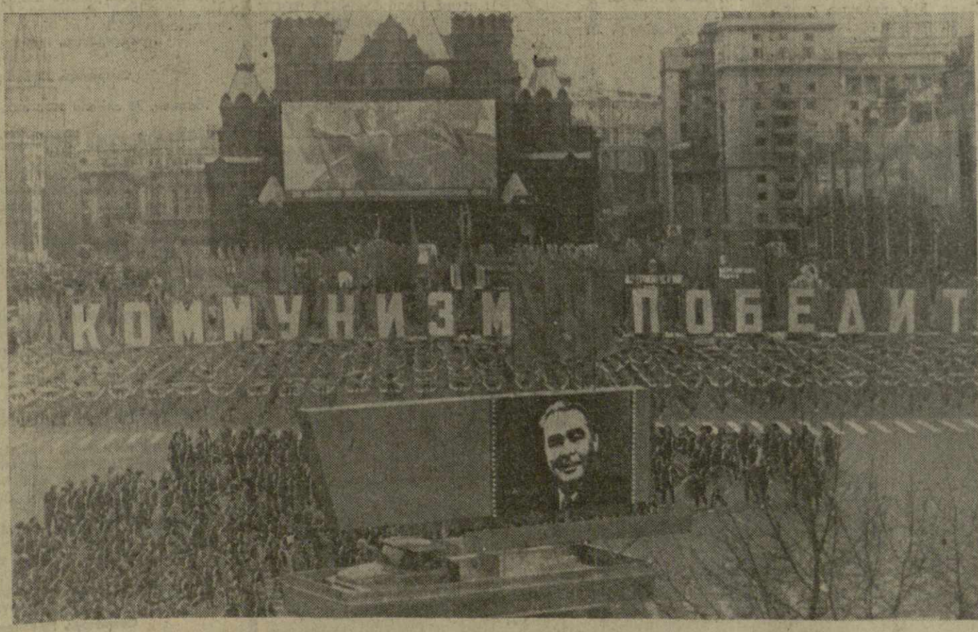
МОСКВА. Празднование 1 Мая 1976 года. Демонстрация представителей трудящихся на Красной площади. На снимке: парад физкультурников.

Фонд знаков отличия Центрального музея Вооруженных Сил СССР пополняется правительственными наградами Героя Советского Союза М. А. Егорова, переданными сюда на вечное хранение. Тридцать один год назад, утром 1 мая, на скульптурной группе, венчающей фронтон здания рейхстага, воздвиг Знамя Победы. Его во- Друзьям разведчики сержант М. Егоров и младший сержант М. Киптария. В экспозиции, повествующей о бесстрашных участниках штурма рейхстага, рядом с фотографиями тех памятных дней теперь представлены ордена и медали коммуниста-бойца, волевым решением над Берлином алым флагом — символом Победы нашей Родины. (Корр. ТАСС.)