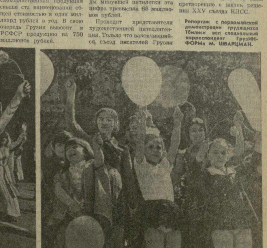
ТБИЛИСИ. 1 Мая 1976 года. На снимках: в колоннах демонстрантов на проспекте имени Руставели.