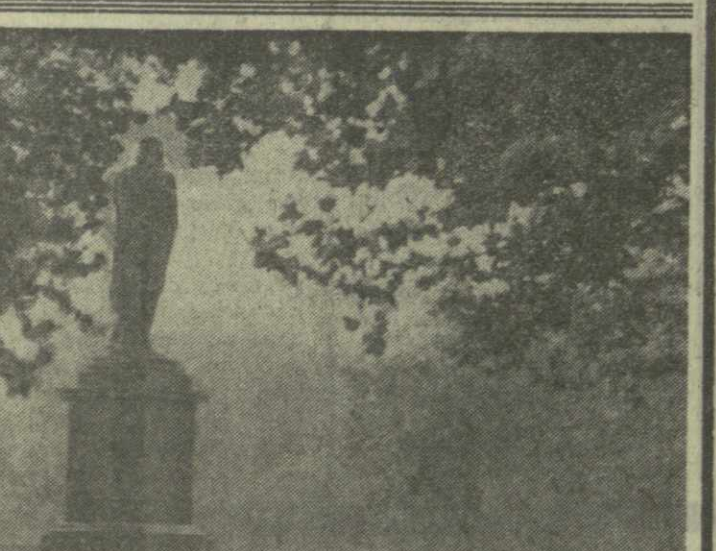
▲ ТБИЛИСИ СЕГОДНЯ. На снимке: утро на набережной Куры.