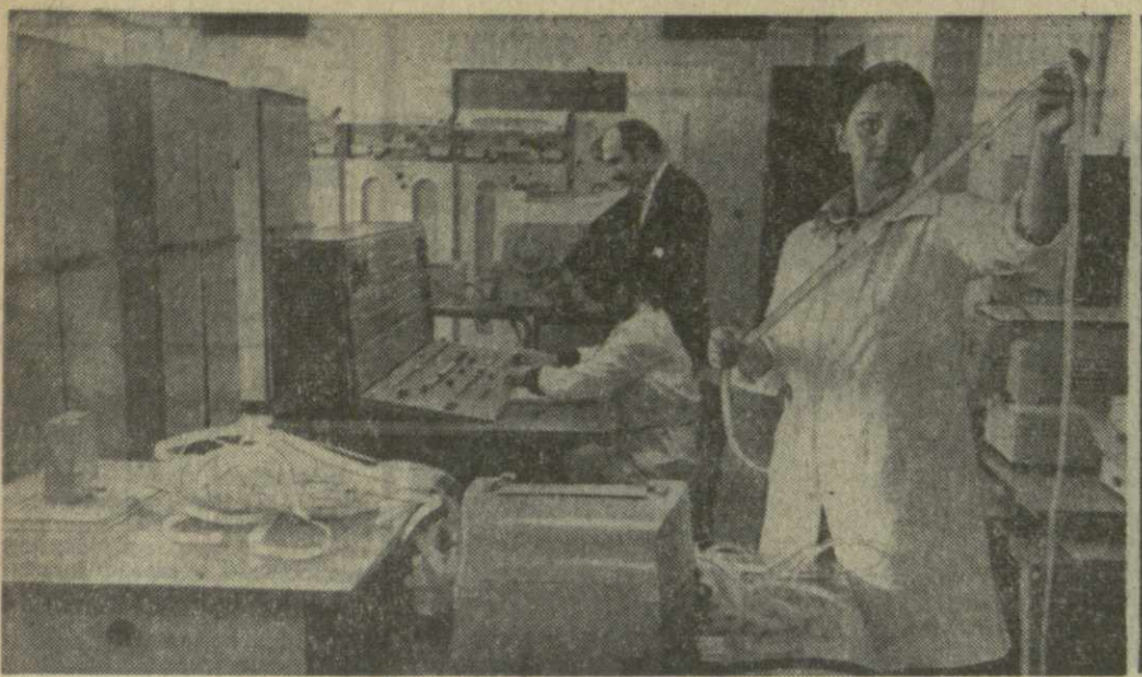
▲ В ЛАБОРАТОРИИ ВЫЧИСЛИТЕЛЬНОЙ ТЕХНИКИ Грузинского научно-исследовательского института механизации и электрификации сельского хозяйства четвертый год работает электронно-вычислительная машина «Минск-22». С ее помощью решаются задачи инженерно-экономического характера, обрабатываются экспериментальные данные исследований работ институтами Министерства сельского хозяйства Грузии.