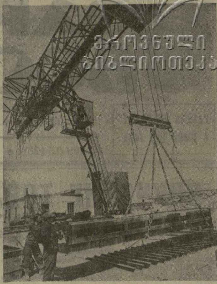
На Тбилиском заводе крупнопанельного домостроения треста № 15 осваивается первая в Грузии вибростанция для производства безарматурной кровли. Уже покрыты эти железобетонными конструкциями два дома в Глдаском жилом массиве. На снимке: общий вид установки.