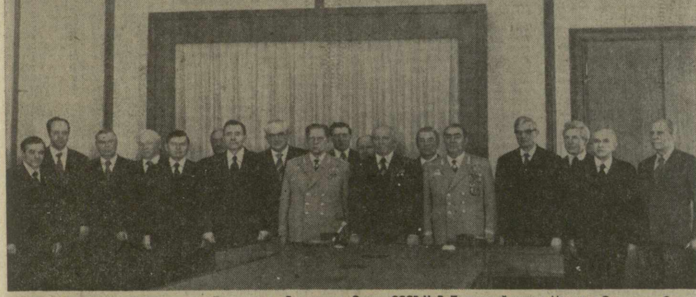
10 мая в Кремле Председатель Президиума Верховного Совета СССР Н. В. Подгорный вручил Маршалу Советского Союза Л. И. Брежневу маршалский знак отличия «Маршальская звезда» и Грамоту Президиума Верховного Совета СССР. На снимке: во время вручения.