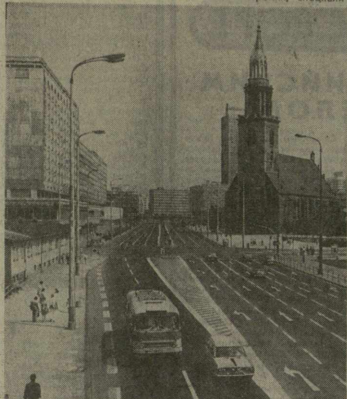
На снимках: Берлин — столица ГДР; рука об руку с советским другом идет вахта в диспетчерской машинного зала тепловой станции Боксберг; автокраны народного предприятия Машинобау «Карл Маркс» в Бабельсберге снимают заслуженную славу.

Более 15 тысяч ученых СССР и ГДР заняты совместной разработкой более чем 800 научных тем. Во многих случаях их решение становится основой дальнейшей кооперации обеих стран в производстве.