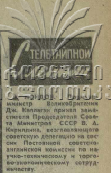
Министр Великобритании Дж. Каллаган принял заместителя Председателя Совета Министров СССР В. А. Кириллина, возглавляющего советскую делегацию на сессии Постоянной советско-английской комиссии по научно-техническому и торгово-экономическому сотрудничеству.

Дж. Каллаган заявил, что правительство Великобритании намерено и впредь проводить линию на всестороннее развитие политического, экономического и другого сотрудничества с Советским Союзом.