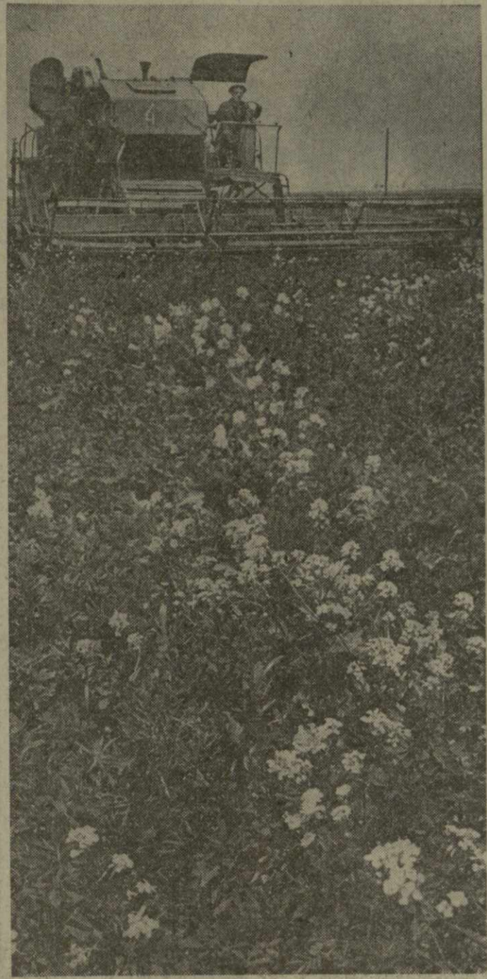
На снимке: сенокос в Марнеульском семеноводческом совхозе.

В МАРНЕУЛЬСКОМ РАЙОНЕ НАЧАЛАСЬ ЗАГОТОВКА КОРМОВ. ПЕРВЫЕ ТОННЫ СЕНАЖА ЗАЛОЖИЛИ КОРМОДОБИТЧИКИ МАРНЕУЛЬСКОГО СОВХОЗА ПО ПРОИЗВОДСТВУ СЕМЯН МНОГОЛЕТНИХ ТРАВ.