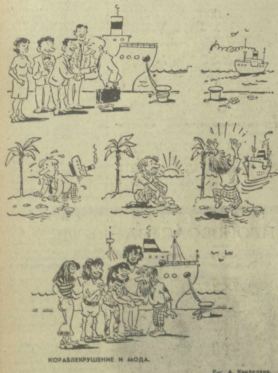
КОРАБЛЕКРУШЕНИЕ И МОДА.