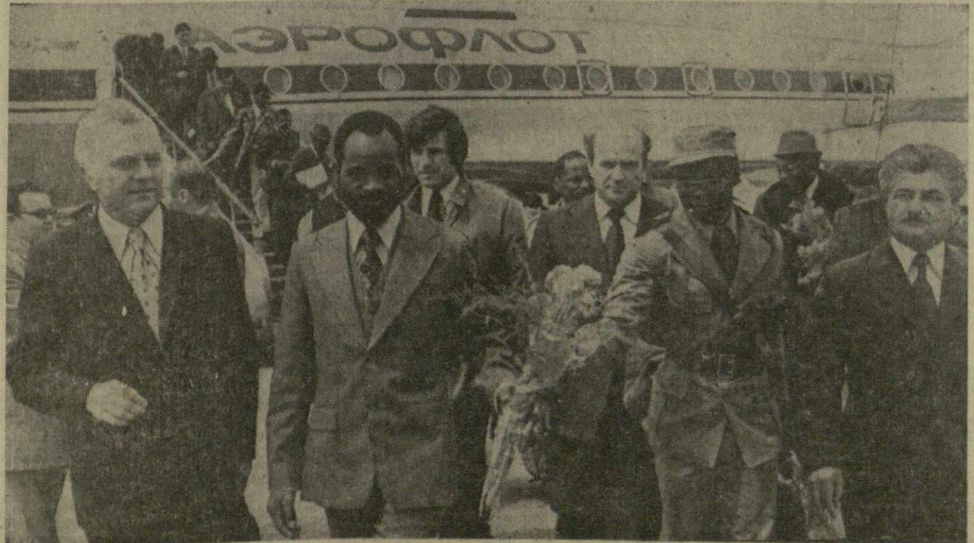
На снимке: встреча в Тбилисском аэропорту.