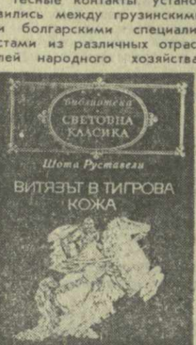
Шота Руставели. ВИТЯЗЬ В ТИГРОВОЙ КОЖЕ

Ежегодно в конце мая болгарский народ отмечает День болгарского просвещения, культуры и славянской письменности. Устраиваются митинги и собрания, демонстрации, в празднике участвует весь народ. Как известно, славянское письмо было создано в IX веке просветителями Кириллом и Мефодием. И в ту же эпоху появились культурные связи между болгарскими и грузинскими народами. Эти древние и глубокие корни сотрудничества особую значимость приобрели в наши дни — в эпоху социалистической дружбы народов. Тесные контакты установились между грузинскими и болгарскими специалистами из различных отраслей народного хозяйства,