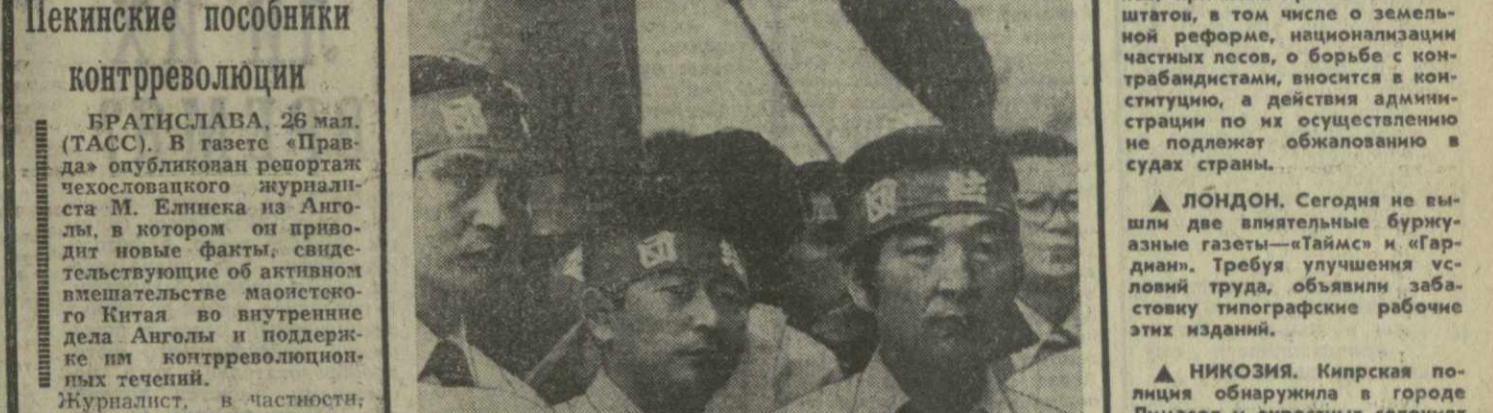
ЯПОНИЯ. Продолжается весеннее наступление трудящихся. Бастуют работники ряда отраслей промышленности. Профсоюзы требуют повышения зарплат, улучшения условий труда. На снимке: на митинге протеста в Токио.