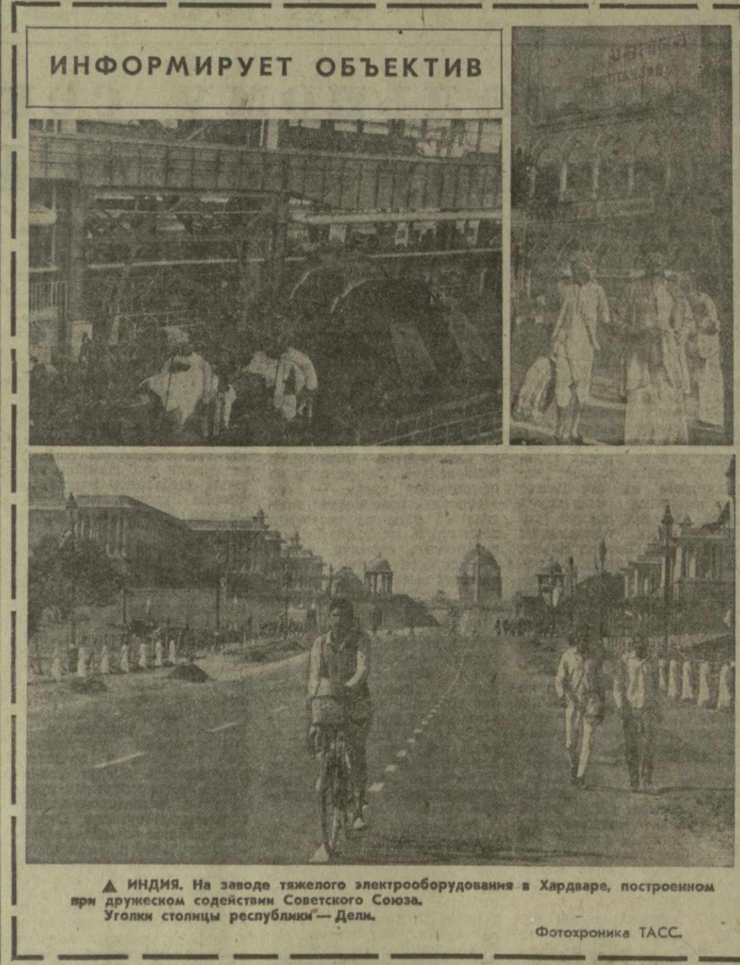
▲ ИНДИЯ. На заводе тяжелого электрооборудования в Хардваре, построенном при дружеском содействии Советского Союза. Уголки столицы республики — Дели.

В коммюнике подчеркивается, что деятельность американской журналистки в Анголе несовместима с ее профессиональным статусом и «оскорбляет достоинство ангольского народа».