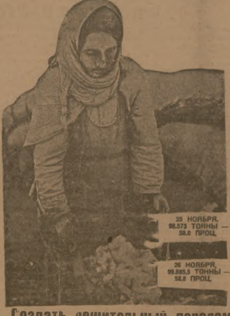
25 НОЯБРЯ, 98.574 ТОННЫ — 88,0 ПРОЦ. 26 НОЯБРЯ, 98.855 ТОННЫ — 88,5 ПРОЦ.