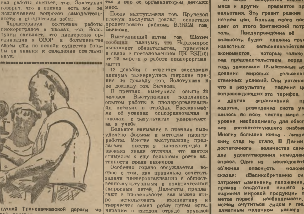
Изыскательские работы на месте будущей Транскавказской дороги через Рокский перевал

ДЖАВА (Наш нар.). Тонгабенский МТФ, Джавского района, терпит поражение: из 121 голы осталось 100. Из 62 телат пало 33. В телятниках нетопленная грязь, беспорядочная выгулка не годится. О кормах на зиму не позаботились. Имеется 100 пудов сена и до 400 пуд. сарая. Значит, оставшийся скот обеспечен грубыми кормами на зиму только на 30-40 проц. Колхозники должны быть к этому вопросу более внимательными. Все это является следствием того, что решение ЦК ВКП (б) от 4 февраля и 26 марта еще не стало основой работы в Тонгабенском МТФ. Надо не терять времени и по-прежнему бороться за повышение и овладение скотными животными. 12 декабря в утреннем заседании пленума развернулись широкие прения по докладу тов. Золотухина и по докладу тов. Бычкова. В прениях выступило свыше 20 человек. Выступавшие подливали опыт работы в пленуморганизации, значительная часть выступавших об успехах организации в школах, о результатах ударничества в учебе. Большое внимание в прениях было уделено формам и методам пленуморганизации. Многие выступавшие предлагали внести в пленуморганизацию в школах и в школах, что является стимулом к еще большему росту активности среди пленумов. Особенно горячо обсуждался вопрос о том, как правильно сочетать задачи пленуморганизации с общешкольными культурными и политическими задачами. Должно быть, пленуморганизация в школах должна использовать инициативу и творчество самих ребят путем организации в каждом отряде кружков любителей фото, радио, химия и т. д.