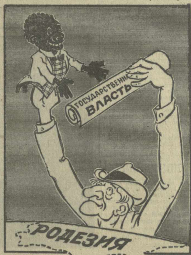
«КУКОЛЬНЫЙ ТЕАТР» В СОЛСБЕРИ. Рис. А. Канделари.

Португальские власти располагают данными, указывает «Капитал», что в северозападной части границы сохраняется незначительная и дисперсная из подпольной организации «Португальская армия освобождения» и испанских террористических групп без труда ее переходят. Имеются, кроме того, сведения, что «боевики» из ПАО тесно связаны с так называемым «международным антикоммунистическим альянсом», который координирует террористическую деятельность в Португалии и Испании. (ТАСС, 5 февраля).