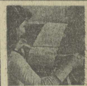
С ТЕЛЕТАЙПНОЙ ЛЕНТЫ

Участники демонстрации и митинга, в которых приняли участие несколько сот тысяч человек, заявили о полной поддержке политики ВВАС, гневно осудили провокации и террор контрреволюционных группировок.