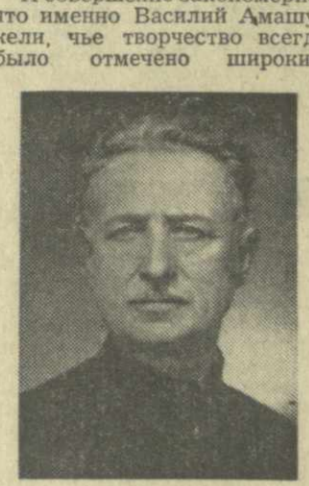
Социальным характером, демократическими тенденциями, стал автором одного из первых в мире полнометражных документальных фильмов «Путешествие Акакия Церетели в Рача-Лечхуми с 21 июля по 2 августа 1912 года». В этой новаторской для того времени картине полностью раскрылся талант В. Амашукели, окончательно определились его художественная и гражданская позиция. Оставаясь верным передовым принципам, нашшему отражению в первых лентах, В. Амашукели создал волнующий, высокопрофессиональный фильм, истинное произведение документального искусства.

знакомой стране. У этих заезжих документалистов появились местные подражатели, которые усердно копировали малодоступные образцы, посвящая ряд сюжетов хронике жизни членов царской семьи, придворной челяди, высокопоставленным чиновникам. Для Василия Амашукели абсолютно чуждо такое верноподданническое мертворожденное «искусство». И совершенно закономерно, что именно Василий Амашукели, чье творчество всегда было отмечено широким