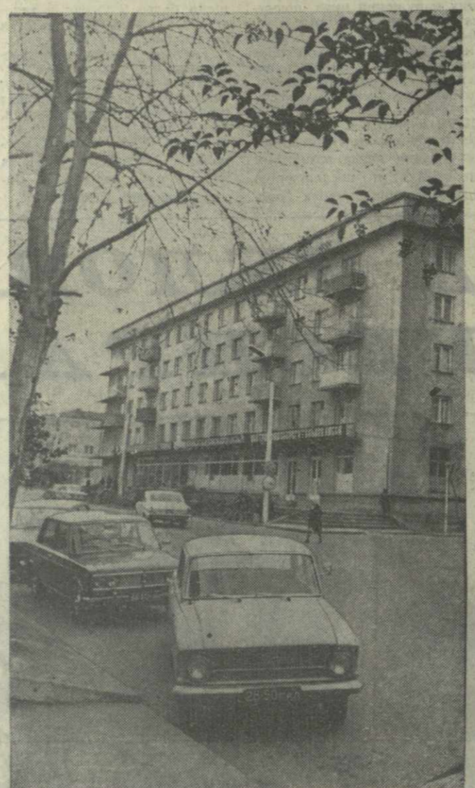
ЦХАКАЯ СЕГОДНЯ. На снимке: один из уголков улицы имени Руставели.