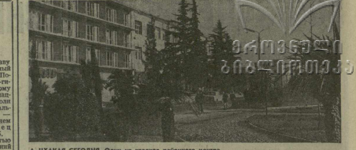
▲ ЦХАКАЯ СЕГОДНЯ. Один из уголков районного центра.