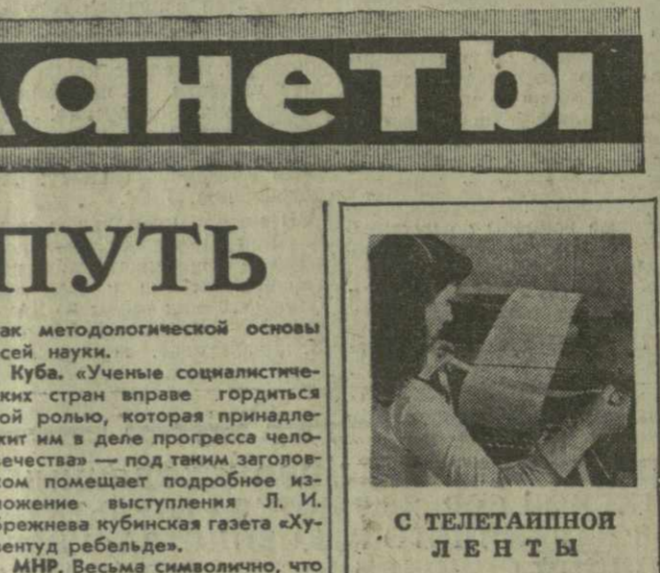
С ТЕЛЕТАШНОЙ ЛЕНТЫ

У современных ученых нет, как, впрочем, не было и у древних, сомнений в том, что войско персидского царя стало жертвой сильнейшей песчаной бури. Уверенность в том, что армия Камбиса погребена где-то на полуострове Харгой и Сивой, всегда вдохновляла египтологов на поиски, но до последнего времени они не приносили никаких результатов. И вот достигнуты первые результаты! Неподдалеку от оазиса Дахла, западнее Харги, египетская экспедиция обнаружила в песне тысячи глиняных кушинов и множество человеческих скелетов. Установлено, что возраст находок — не менее 2 тыс. лет. Но самое главное в том, что кушину такой формы никогда не делали ни древние египтяне, ни арабы. Поэтому выдвинуто предположение о том, что воду в этих сосудах хранили не кто иной, как ратники Камбиса. Но пока, предпочитают руководители археологической службы АРЕ, окончательный вывод делать рано. Чтобы избежать ошибки, на место находки должна быть снаряжена хорошо подготовленная экспедиция. А. СУРИКОВ. (ТАСС).