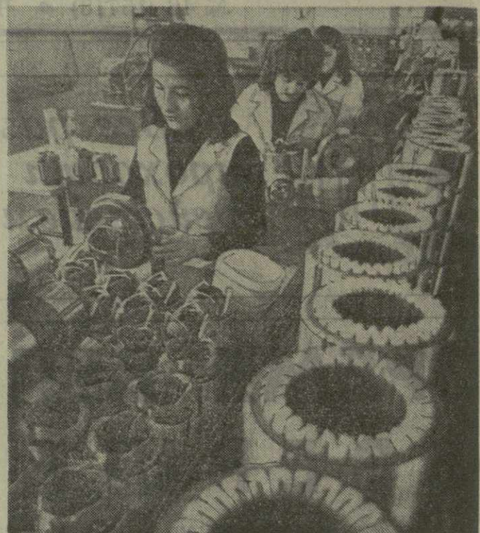
На снимке: участок Бандажировки электродвигателей в цехе № 6.

ВНИИэлектромаш, тбилиских конструкторов в из ВНИИТМЭ, работников Ленинградского ВПТИэлектро. Подобные визиты конструкторов и проектировщиков не проходят бесследно.