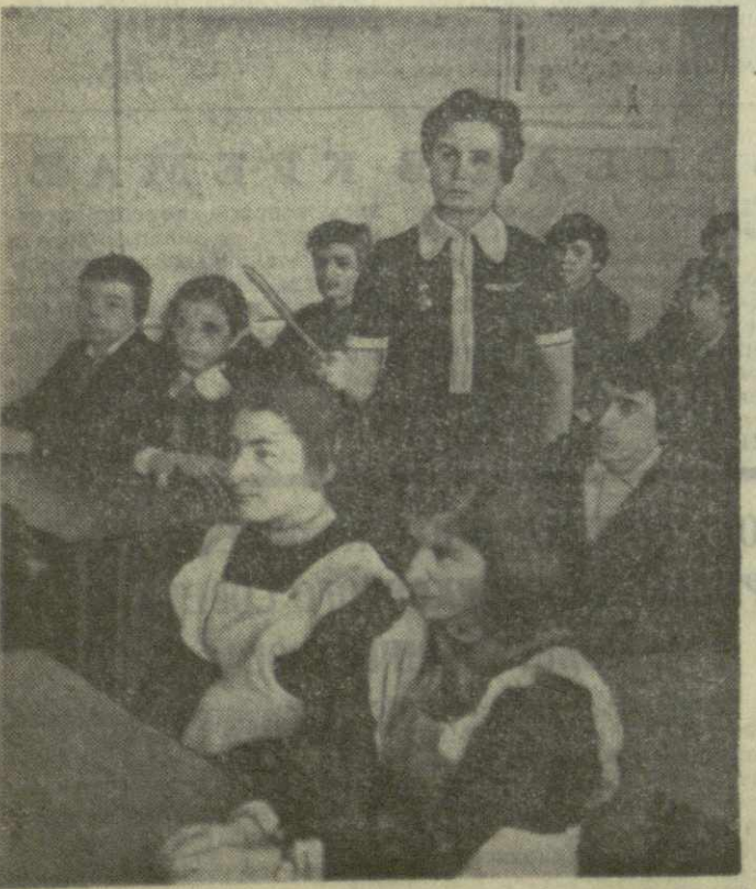
Проблемное обучение... Это не какой-то особый метод, который можно применять в школе, а можно и не применять.

Постепенно шаг за шагом школа выбрала из трисны долгого отставания, стала одной из лучших в районе.