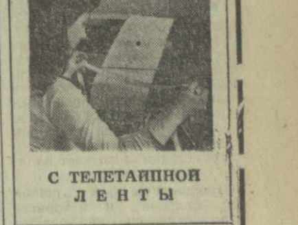
С ТЕЛЕТАИПНИ ДЕНТЫ

Ученые также продолжают исследовать с помощью орбитальных отсеков двух космических станций. Недавно была изменена орбита отсек «Викинг-1», который сейчас ежедневно пролетает над планетой на расстоянии от 100 до 400 километров — от одного из естественных спутников Марса — Фобоса. Первые фотографии этой крошечной марсианской «луны» передаются на Землю в виде телевизионных исследований. Через несколько месяцев намерено приблизить «Викинг» к другому спутнику Марса — Деймосу.