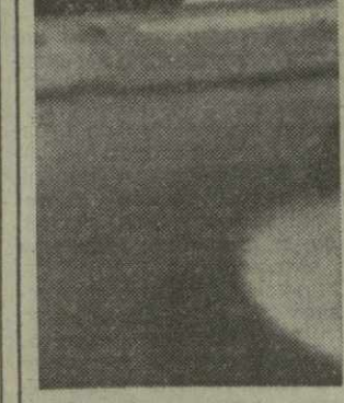
▲ ВКЛЮЧИВШИ СЬ в о

Бесспорное социалистическое соревнование и стремление достойно встретить 60-летие Великого Октября, коллектив Чхатарской швейной фабрики решил во втором году десятой пятилетки повысить производимость продукции и реализовать план продаж государству мясной и молочной. Однако не все животноводческие хозяйства работают в полную силу, используют имеющиеся резервы. Так, хозяйства 15 районов не справились с планами заготовки мяса, а в 19 районах — молока. В хозяйствах 10 районов среднегодовой надой молока от каждой коровы значительно ниже планового. Превратить в прошлом крайне запущенную отрасль в ведущую возможно, если каждый колхоз, совхоз, комплекс, каждый район добьется ускоренного развития животноводства. Будет использоваться и использовать резервы на каждом участке производства, укреплять кормовую базу.