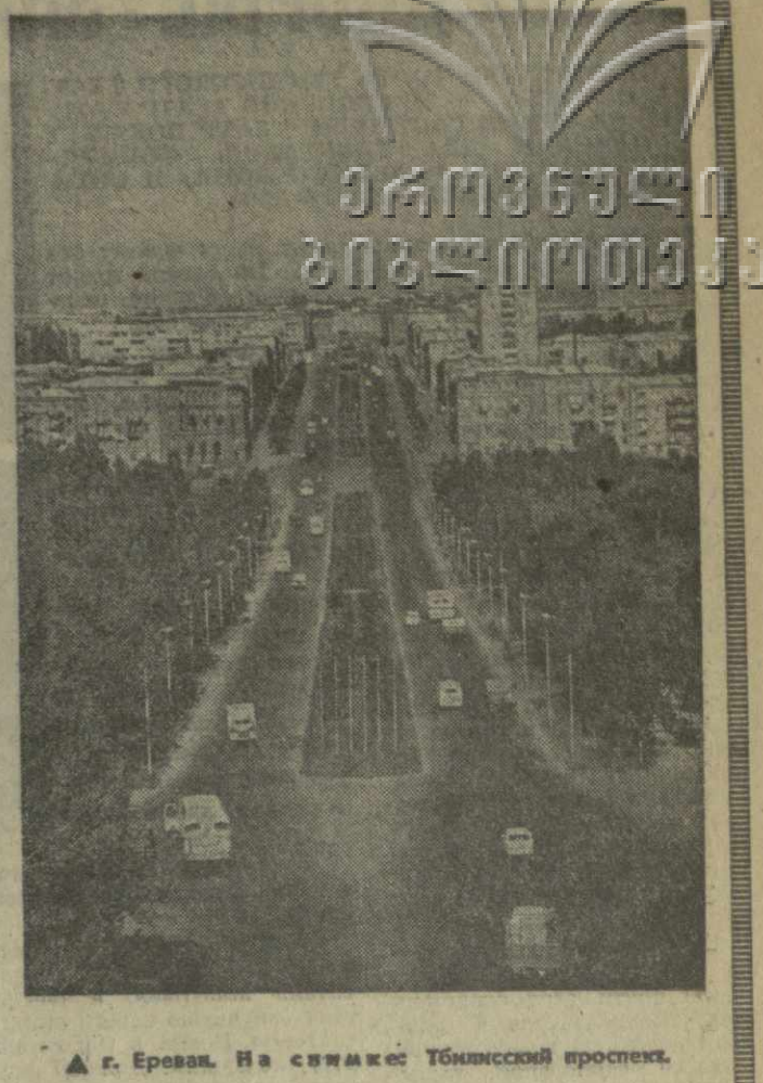
▲ Г. Ераван. На снимке: Тбилисский проспект.

еще более яркие перспективы развития. По инициативе Генерального секретаря ЦК КПСС товарища Леонида Ильича Брежнева ЦК КПСС и Совет Министров СССР в апреле приняли историческое постановление «О мерах по дальнейшему развитию народного хозяйства Армянской ССР, которое является новым ярким проявлением заботы Коммунистической партии и Советского правительства об армянском народе. Величественные задачи социализма требуют от нас дальнейшего углубления межреспубликанских экономических связей. Узы тесной, нерушимой дружбы и сотрудничества связывают братские республики Закавказья — Грузию, Азербайджан и Армению, народы которых, соревнуясь друг с другом, добиваются новых больших успехов в коммунистическом строительстве. Мы находимся в преддверии большого исторического события — XXV съезда Коммунистической партии Советского Союза. Трудящиеся Советской Армении прилагают все усилия для того, чтобы с честью завершить задания завершающего года 9-й пятилетки и достойно ознаменовать открытие съезда родной партии новыми успехами во всех областях хозяйственного и культурного строительства.