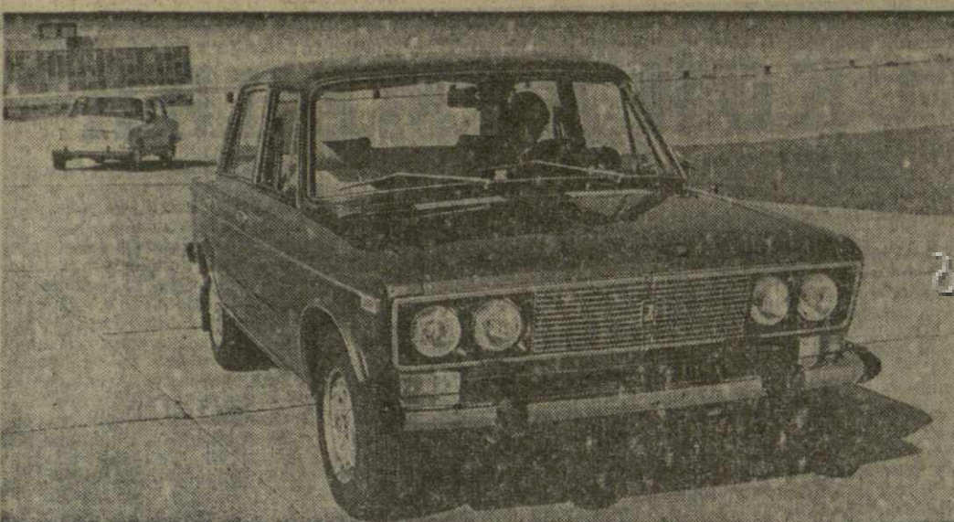
На снимке: ВАЗ-2106 на заводском автодроме.

А ТОЛЬЯТИ. Создана новая модель «Жигулей» ВАЗ-2106 предусматривающая социалистическим обязательствам на заволашующий год пятилетия, взятым коллективом Волжского автозавода.