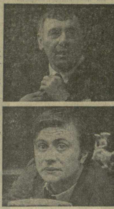
ИНФОРМАЦИЮ ДОСТАВИЛ ПОЧТАЛОН

НА ЭТОТ РАЗ ГОСТЬ ТБИЛИСКОГО ТЕАТРА «ДРУЖБА» — МОСКОВСКИЙ ТЕАТР САТИРЫ. ЗА ВРЕМЯ ГАСТРОЛЕЙ ТЕАТР ПОКАЖЕТ ТБИЛИСЦАМ ДВА СПЕКТАКЛЯ: «МАЛЕНЬКИЕ КОМЕДИИ БОЛЬШОГО ДОМА» И СПЕКТАКЛЬ-ОБЗОРЕНИЕ «НАМ — 50!».