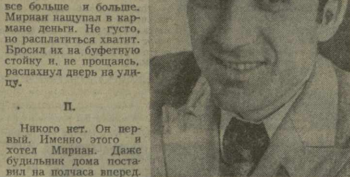
Мирян в сердцах хлопнул дверью...

Авария была ликвидирована. Рисовал он тогда? В какой-то мере — да! Но, если честно, то был уверен — ребята не отступят, придут на помощь. — Разноголосый хор подвывавших голосов раздражал