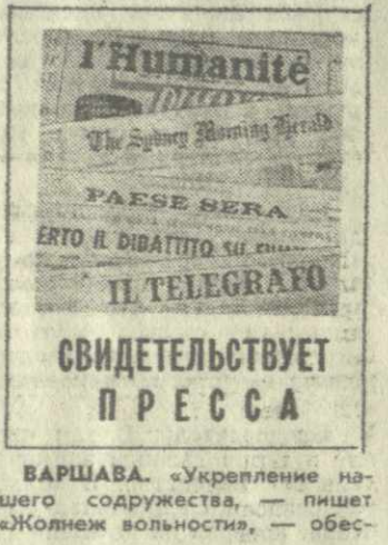
ВАРШАВА. «Укрепление нашего содружества», — пишет «Жолнеж волиности», — обещает каждому из братских народов оптимальные условия мирного труда и безопасности. Социалистическое содружество является в современном мире надежным оплотом сил свободы, прогресса и мира.

Зарубежная печать продолжает освещать работу VII съезда ПОРП, уделяя большое внимание речи Генерального секретаря ЦК КПСС Л. И. Брежнева, который возглавлял делегацию КПСС на съезде. Во многих комментариях отмечается, что согласованная политика государств социалистического содружества в международных делах, направленная на упрочение мира и развитие международного сотрудничества, пользуется активной поддержкой всех прогрессивных и миролюбивых сил и приносит все более весомые результаты.