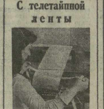
С телетайпной ленты

ЛОНДОН. Премьер-министр Великобритании Г. Вильсон принял находящегося здесь министра внешней торговли СССР Н. С. Папилова. В беседе были затронуты вопросы торгово-экономического сотрудничества двух стран. Г. Вильсон подчеркнул готовность правительства Англии и дальше развивать всестороннее сотрудничество с Советским Союзом. СТОКГОЛЬМ. Здесь состоялась церемония вручения Нобелевской премии по экономическим наукам советскому ученому академику Л. В. Канторовичу. РАБАТ. Как сообщило рабочее радио, вчера утром крупные подразделения марокканских войск вступили в Эль-Аюн, административный центр Западной Сахары. ЛУАНДА. В волнующую демонстрацию единства народа и партии вылилось празднование в Луанде 19-й годовщины Народного движения за освобождение Анголы (МПЛА). На столичной площади имени Первого мая состоялся многотысячный митинг трудящихся, молодежи и воинов национальной армии. Перед собравшимися выступил президент республики Агостиньо Нето. МАДРИД. Здесь объявлен состав нового испанского правительства, сформированного Карлосом Ариасом Наварро. Заместителем председателя правительства и министром внутренних дел назначен Мануэль Фрага Ирибарне, министром иностранных дел — Хосе Мария де Аренсия-Фернандес Роде. Здесь отмечают, что в составе нового кабинета остались три министра предыдущего правительства Испании. (ТАСС, 12 декабря).